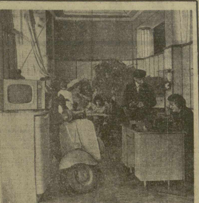
Этот снимок фотокорреспондент М. Бабов сделал в бюро добрых услуг, находящемся в г. Рустави. Посетителям здесь оказываются самые разные услуги: ремонт радиоприемников, телевизоров, мелких домашних вещей и т. д. Большой популярностью у руставцев пользуется и пункт проката при бюро.

Д. КАЦАРАВА, старший инженер Министерства местной промышленности Грузинской ССР.