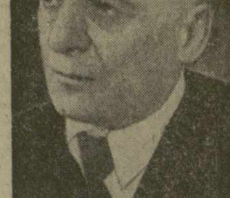
Министерство высшего и среднего специального образования Грузинской ССР; Тбилисский государственный университет; Грузинское отделение химического общества им. Д. И. Менделеева.

С каждым годом хорошеет и благоустривается курорт Кобулет. Недавно здесь вступил в эксплуатацию лечебный корпус санатория «Кобулет». Четвертое управление Министерства здравоохранения Грузинской ССР.