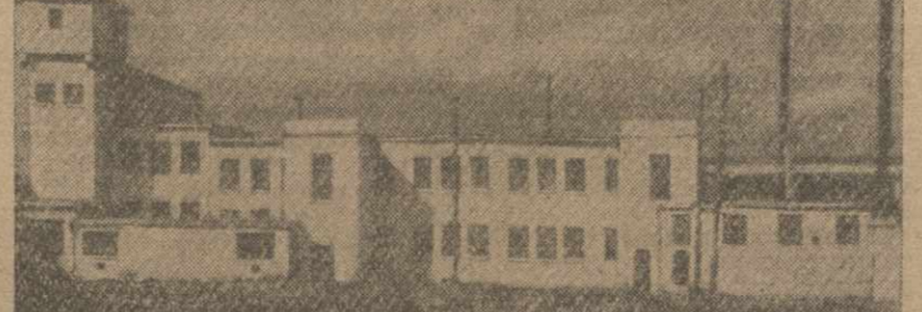
Хлебопеченье в Буну. Завод снабжает хлебом ежедневно Ленинский, Сураханский и Чернореченский районы...