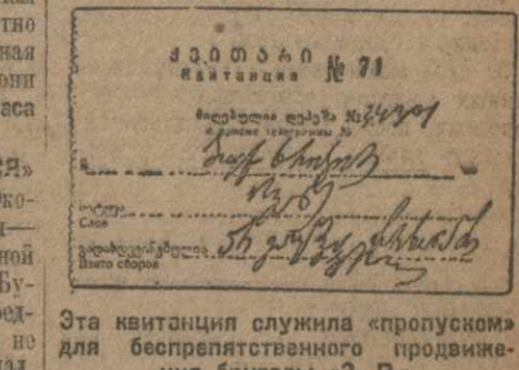
Эта квитанция служила «пропуском» для беспрепятственного продвижения бригады «З. В.»

«ПРОПУСК ПЕЧАТЬЮ». Час ночи. Едем на механическую станцию Рингоса. Подходим к товарищу мастеру в надежде беспрепятственно проехать и здесь, но нас останавливают охранники. Вместо пропусков сумку простую бумажку — коротенькую квитанцию в примо телеграмм. По этому «пропуску» и проходим на участок. Около мастерских стоят паровозы. Паровоз № 10 стоит на вагонных путях, ожидая выхода на работу (в 6 час. утра).