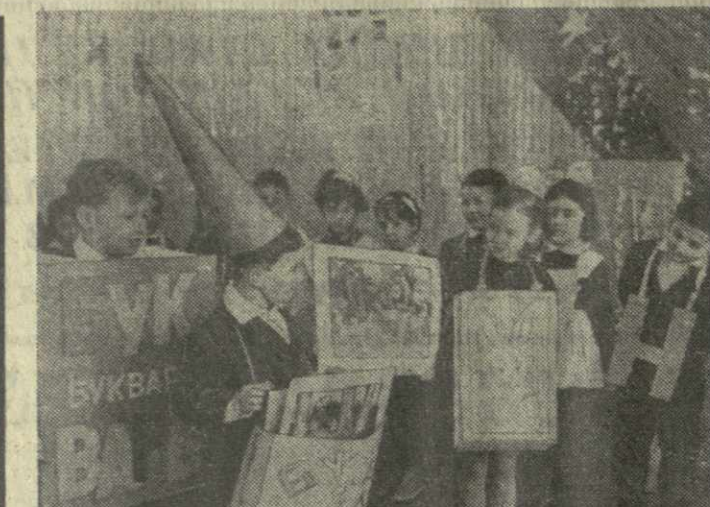
Весело и интересно проводят школьники зимние каникулы. Первоклассники 35-й тбилисской средней школы в первый день своих каникул провели праздничный утренник «Проводы букашки» (справа слева). А вот старшесекционка 28-й московской школы путешествует по стране. В Тбилиси ее тепло и радушно встретили учащиеся 43-й школы. Гости и хозяйка вместе сфотографировались у стен древней Нарикалы (справа).

В вестимале Тбилисского университета открылась фотовыставка, отражающая жизнь и деятельность академика В. Топурия.