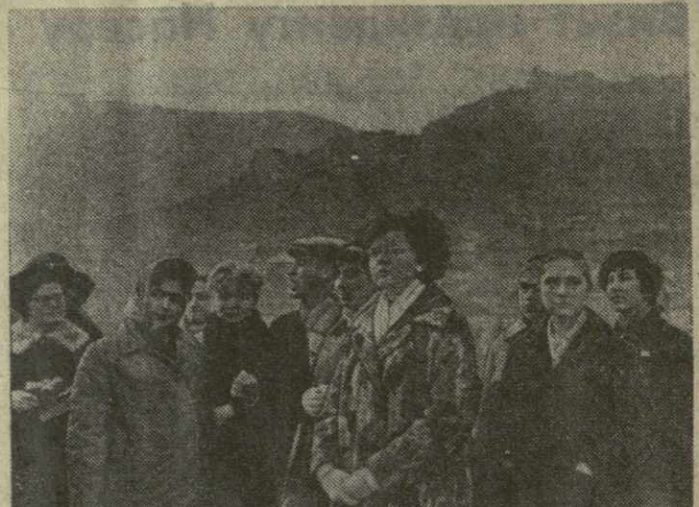
В издательстве «Советский писатель» выходит книга литературных очерков, статей и воспоминаний выдающегося грузинского писателя Симона Чиковани. Мы печатаем фрагменты из ряда выступлений и воспоминаний покойного поэта, 65 лет со дня рождения которого исполняется сегодня.