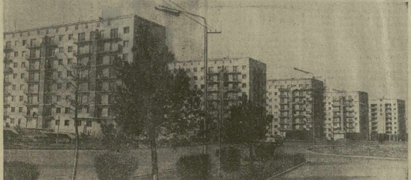
Строители социалистического Рустави взяли обязательство сдать в этом году в эксплуатацию 20.300 квадратных метров жилой площади. На снимке: один из новых жилых кварталов.