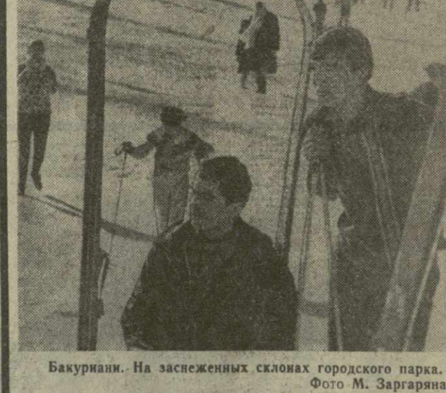
Бакуриани. На заснеженных склонах городского парка.

шестие на международном шахматном турнире. Он одержал седьмую подряд победу над итальянцем Росселло. Таки амйрал отложившую из шестого тура партию с белыми Боболюмом и победила затем очко с югославским гроссмейстером Ивковым. Встреча румыны Георгиу и чехословацкого гроссмейстера Горта закончилась ничью. Вслед за лидером идут Таки и Георгиу — по 4,5 очка и Горт — 4.