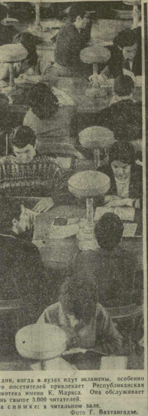
В дни, когда в душах идут экзамены, особенно много посетителей привлекает Республиканская библиотека имени К. Маркса. Она обслуживает в день свыше 3.000 читателей. На снимке: в читальном зале.