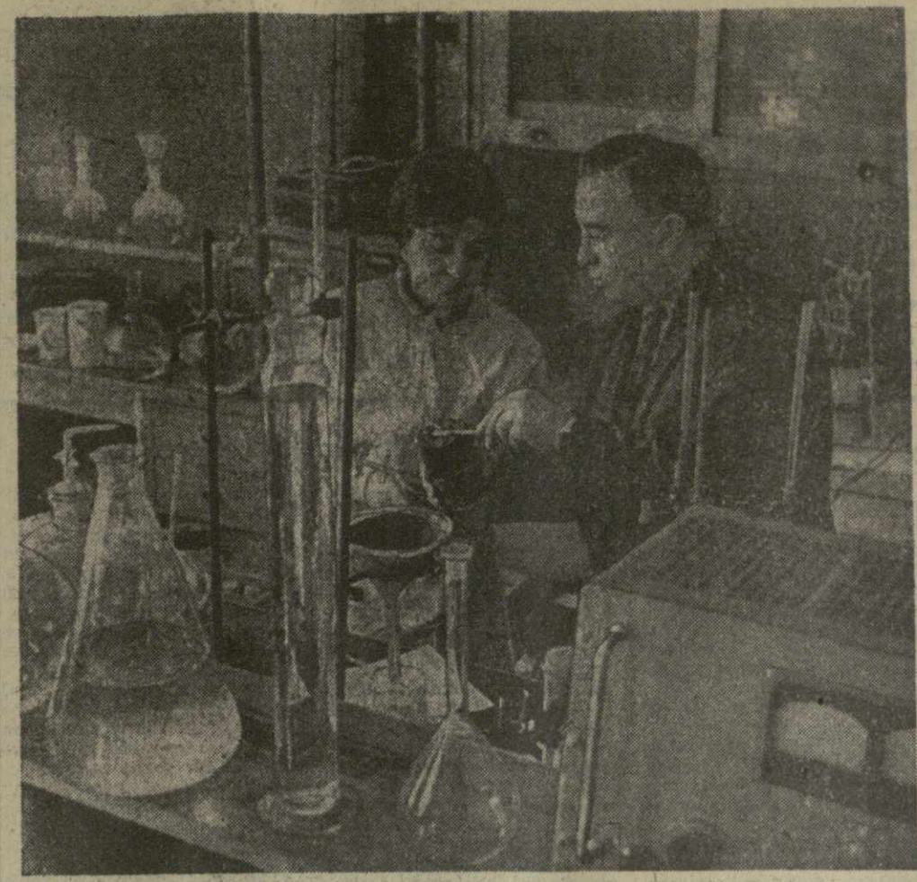
В лаборатории источников тока Института неорганической химии и электрохимии Академии наук ГССР успешно разрабатывается технология получения важного для народного хозяйства продукта — крупнокристаллической электролитической двуокиси марганца. Источники тока, получаемые на ее основе, значительно превосходят своими электротехническими характеристиками существующие.