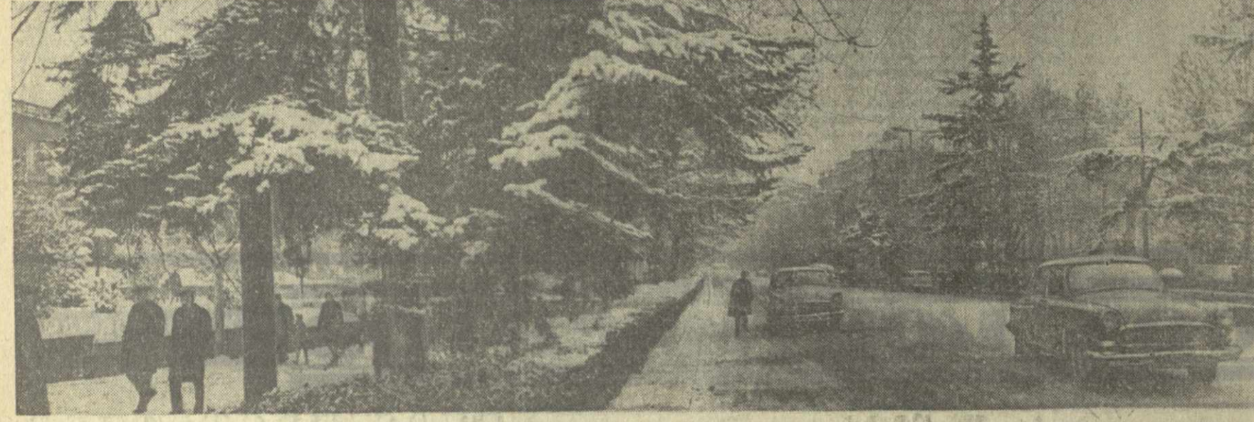
Тбилиси, 23 января 1968 года. Проспект имени Ш. Руставели в зимнем убранстве.