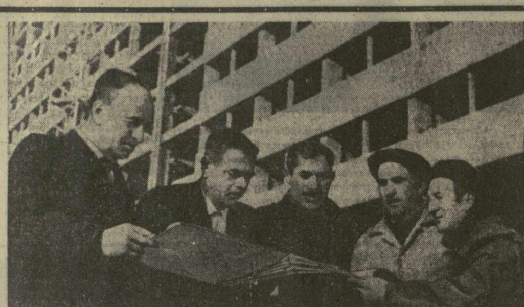
ПРОБЛЕМУ ОБСУЖДАЮТ СПЕЦИАЛИСТЫ