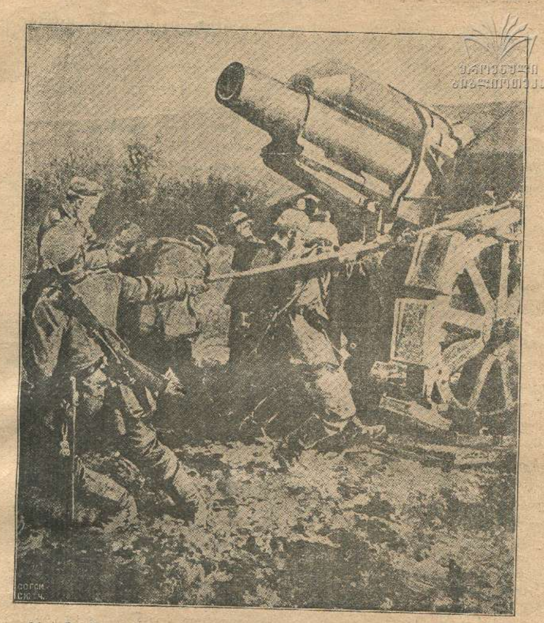
21 სანტიმეტრიან ავსტრიელ ზარბაზნის გამაგრება საომარ პოზიციაზედ.

მოლუნეს შვილდი, მოდვესსაცერე და ერთმანეთსა ტყოლცნეს ისარი. მაგრამ ორივემ სწორის სიმარდით მას მიაგებეს მათ მ.თი ფარი და აიცილეს მითი ფინთიხი, გულის გამპობა, ხორცის მომწყვლელი!... მერე გადაგდეს შვილდები მხარზე და ხმლებს მოავლეს საომრათ ხელი. მათი ფარ-გება და კენწლაობა, სიჩქარით ელვა, გასაკვირვალი, მაჩხუბართ მხოლოთ პრაზს უმატებდა და ედებოდათ თან-და-თან ალი!