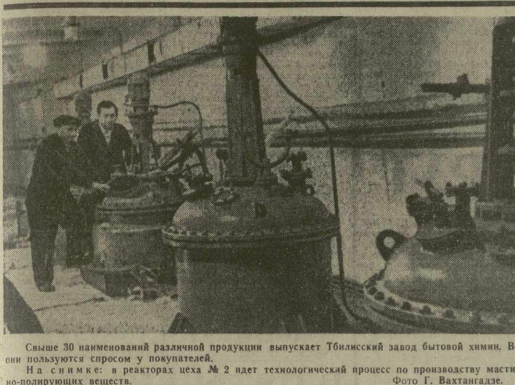
Свыше 30 наименований различной продукции выпускает Тбилисский завод бытовой химии. Все они пользуются спросом у покупателей.