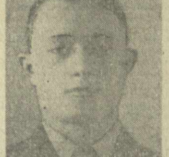
«Привет дорогой маме! Прежде всего желаю тебе здоровья и долгих лет жизни,»

Желаю тебе всего хорошего. Чувствую себя неплохо. Нас отделил с передовой на отдых, чтобы потом с новыми силами бить врага. В селе все нас уважают, заботятся о нас. Меня интересует жизнь Тбилиси. Что там у вас нового, как живут люди? Скоро напишу подробно. Привет всем.