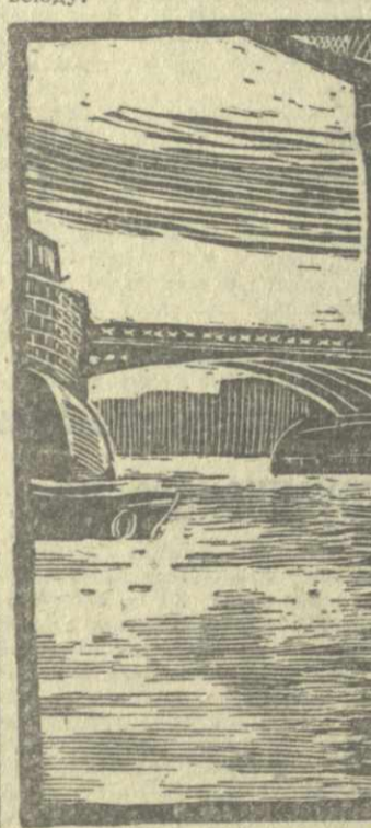
Лондон. Тауэрский мост.

романы Дикенса, рыжебородые коммерсанты, печальная история Оливера Твиста, и перед глазами прошла галерея знакомых с детства лиц. Деловая часть Лондона во времена Дикенса почти не изменилась. Раеве что увеличился масштаб застройки, появились матерые биржевики. Вечером Сити вымирает. На улицах нет ни души. Жизнь переселяется в Сохо — гигантский остров развлекений, где каждый проводит время так, как ему нравится и как позволяют средства. Здесь наглядно убеждаешься в том, что дикенсовская Англия претерпела значительные изменения.