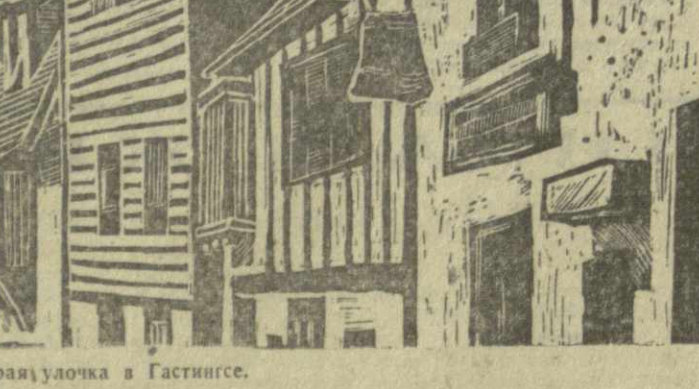
Старая улочка в Гастинге.