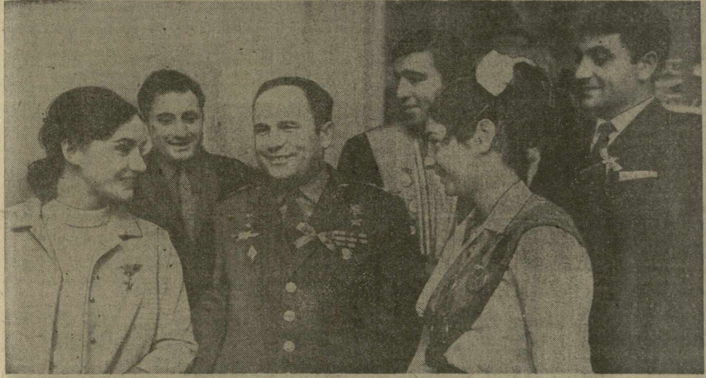
На снимке: летчик-космонавт СССР, Герой Советского Союза В. В. Горбатко среди делегатов XXVIII съезда комсомола Грузии.