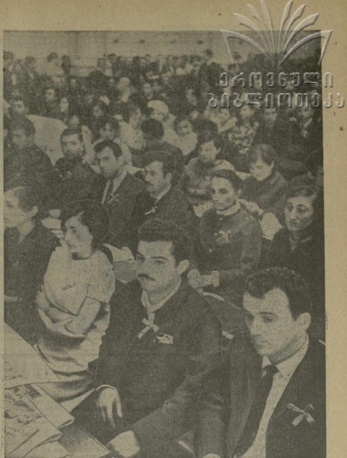
На снимке: в зале заседаний XXVIII съезда комсомола Грузии.

чиво овладевающие знаниями, готовящиеся стать высококвалифицированными специалистами. Образцы политической и боевой подготовки показывают молодые воины, зорко и бдительно охраняющие священные рубежи Отчизны. Центральный Комитет Коммунистической партии Грузии призывает Ленинский Коммунистический Союз Молодежи Грузии и впредь неустанно воспитывать юношей и девушек в духе пламенного советского патриотизма, пролетарского интернационализма, дружбы и братства народов. Необходимо и впредь учить молодежь работать и жить так, как заповедал В. И. Ленин, прививать молодежи принципы коммунистической морали, формировать у нее марксистско-ленинское мировоззрение, классовое самосознание, высокую идейную убежденность, воспитывать ее в духе преданности коммунистической партии. Да здравствует Ленинский комсомол — боевой авангард молодежи, верный и надежный помощник КПСС! Да здравствуют советские юноши и девушки — наше будущее, наша надежда! Слава Коммунистической партии Советского Союза, заботливо направляющей революционную энергию молодежи на борьбу за торжество коммунизма!