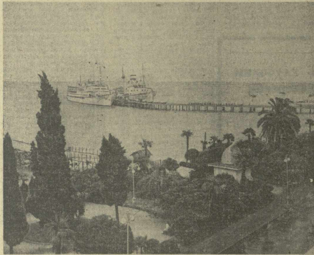
Раскинувшись на узкой прибрежной полосе, Сухуми как бы соткан из солнца, зелени, моря. Широкие, утопающие в зелени магистраль, аллеи парков и садов, украшенные экзотическими растениями дома — все это создает неповторимый облик города-курорта, города-сада.

На снимке: один из уголков города-курорта.