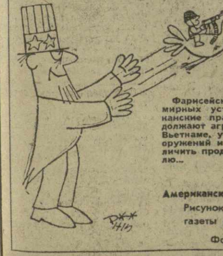
Американский голубь «мира». Рисунок из американской газеты «Дейли уорлд».

ЛЕЙПЦИГ, 3 марта. (ТАСС). Посол СССР в ГДР П. А. Абрамов устроил вчера в Лейпциге прием по случаю пребывания здесь советской правительственной делегации, возглавляемой заместителем Председателя Совета Министров СССР Л. В. Смирновым.