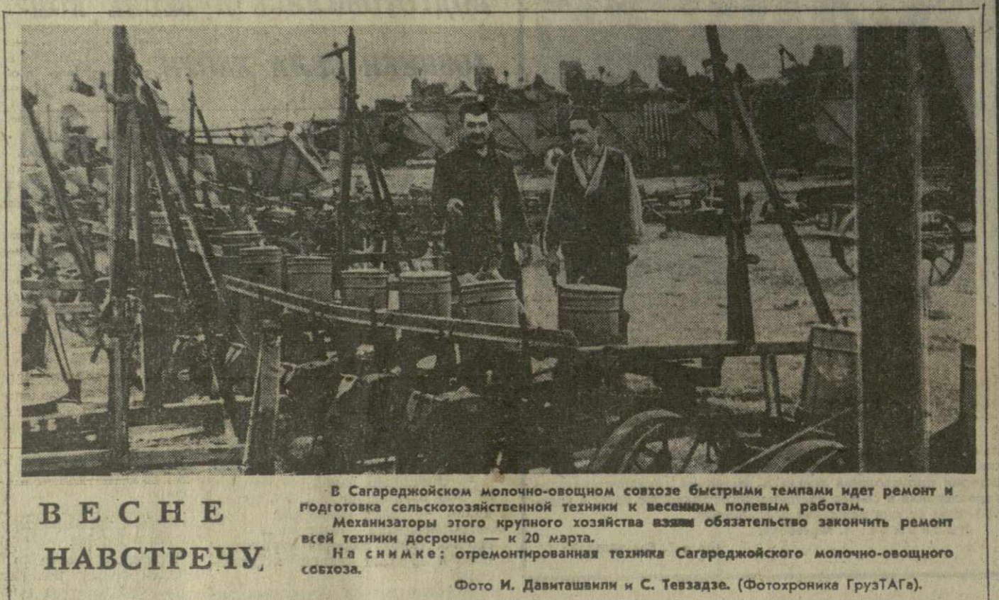
В Сагарейском молочном совхозе быстрыми темпами идет ремонт и подготовка сельскохозяйственной техники к весенним полевым работам.