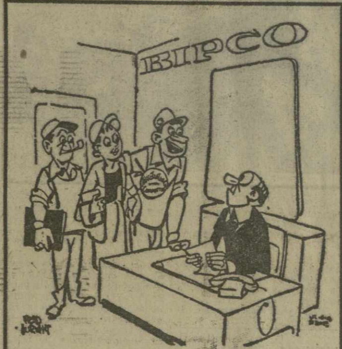
У АМЕРИКАНСКОГО БОССА. Делегация рабочих: хорошо, мы не будем больше требовать сокращения рабочей недели. А как насчет увеличения выходных? Карикатура из американской газеты «Дейли уорлд».

Вашингтон, 10 марта. (ТАСС). Так называемые «разъяренные» Белого дома относительно американского участия в военных действиях в Лаосе мало кого убедили в США. Президент Никсон рассказал далеко не всю правду о событиях, развернувшихся в Лаосе, заявил в связи с этим сенатор Мансфилд. Новые факты свидетельствуют о том, что за завесой секретности правительство фактически превратило Лаос во вторую Вьетнам.