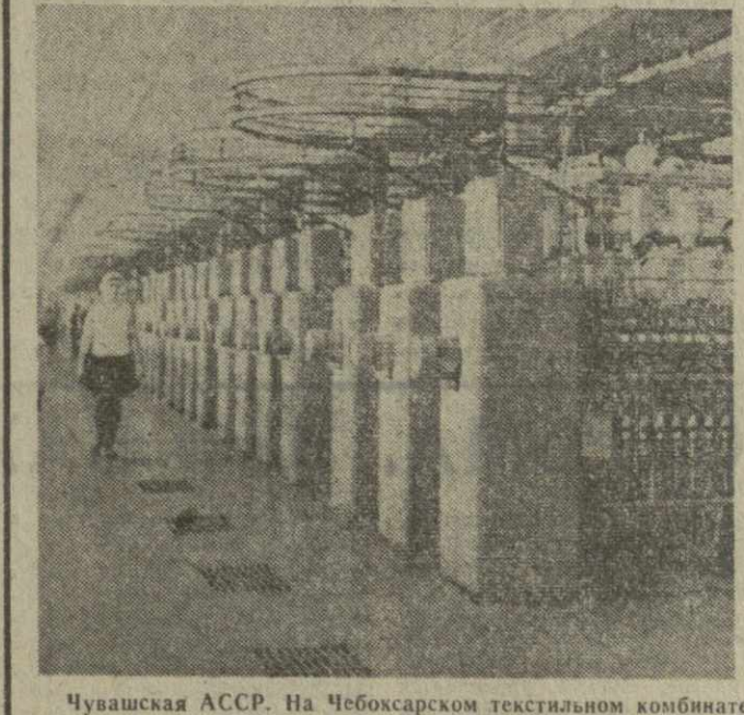
Чувашская АССР. На Чебоксарском текстильном комбинате построена первая очередь прикладно-ниточного производства. На снимке: прикладный цех нового предприятия.

Цветные телевизоры с экраном в 40 и 59 сантиметров по диагонали могут принимать и обычную черно-белую программу.