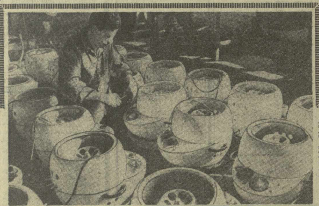
Партия центрифуг, изготовленная для Советского Союза бригадой социалистического труда на заводе Д. Турниера на заводе химического машиностроения в Будапеште.

Хельсинки, 15 февраля. (ТАСС). Сегодня У. К. Кекконен переизбран президентом Финляндии на 6-летний срок. Он получил большинство — 201 голос из 300 голосов выборщиков, избрание которых состоялось 15-16 января с. г.