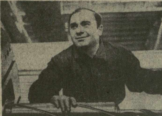
Г. ЛАНЦХАВА. (Спец. корр. «Зари Востока»).