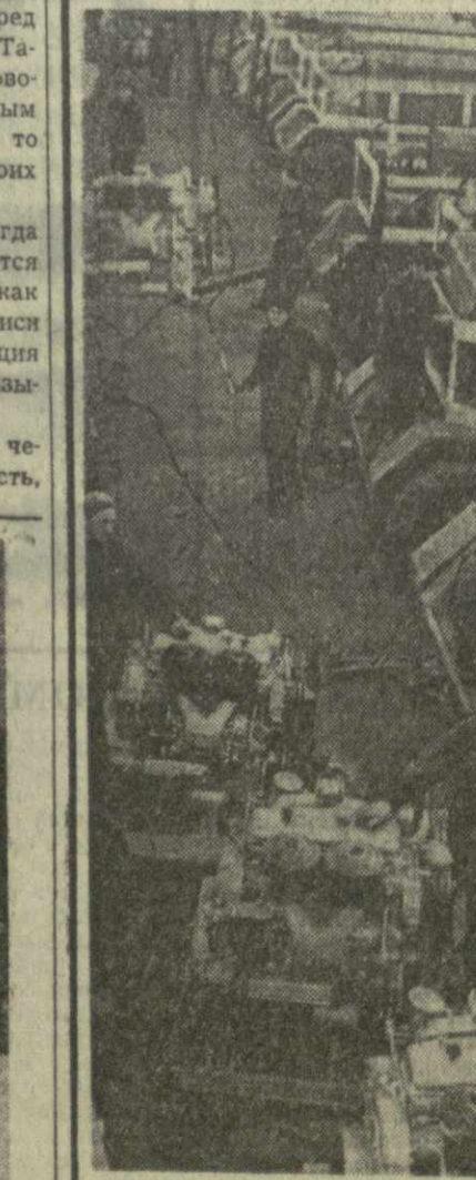
Включившись в социалистическое соревнование за досрочное выполнение пятилетки, коллектив тбилисского завода «Электросварка» взял на 1968 год повышенное обязательство: выпустить сверх плана продукции на 12.000 рублей и освоить 6 новых видов электросварочных машин. На снимке: общий вид сборочного цеха завода.