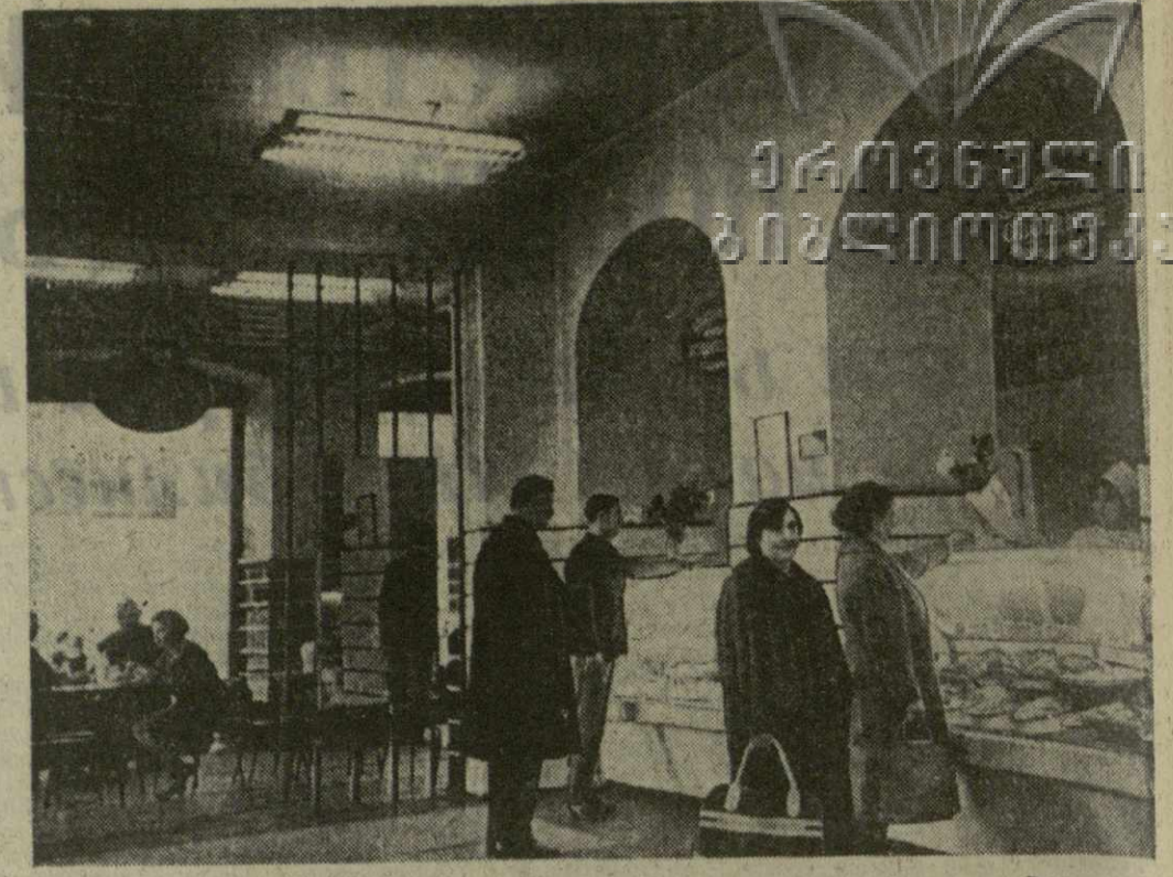
Из года в год в столице нашей республики ширится сеть предприятий торговли. В настоящее время в каждом районе Тбилиси имеются специализированные магазины, в которых можно приобрести полуфабрикаты из высококачественных продуктов. На снимке: магазин полуфабрикатов на площади Карла Маркса в Октябрьском районе.

чению спроса населения на товары народного потребления и конъюнктуры торговли. В нынешнем году и до конца пятилетки значительно возрастет сеть предприятий розничной торговли и общественного питания, укрепится их материально-техническая база, еще шире и увереннее будут применяться прогрессивные формы торговли, поднимется культура обслуживания, труд наших работников будет организован на научной основе. Должное внимание будет уделено и торговле на колхозных рынках. Будут приняты самые решительные меры для выполнения плана по строительству, ремонту и благоустройству рынков, усилен контроль за их работой, значительно увеличится завод сельскохозяйственных продуктов. Несмотря на большие достижения, у нас еще и много недостатков. Зачастую бывает ограничен ассортимент товаров, низка культура обслуживания, встречаются случаи нарушения цен и правил торговли. Значит, задача состоит и в том, чтобы под руководством партийных организаций и с помощью широкой общественности быстрее их изжить. Мы уверены, что многочисленная армия торговых работников, призванная обслуживать трудящихся республики, успешно справится со всеми этими задачами, добьется новых успехов в борьбе за досрочное выполнение заданий пятилетки.