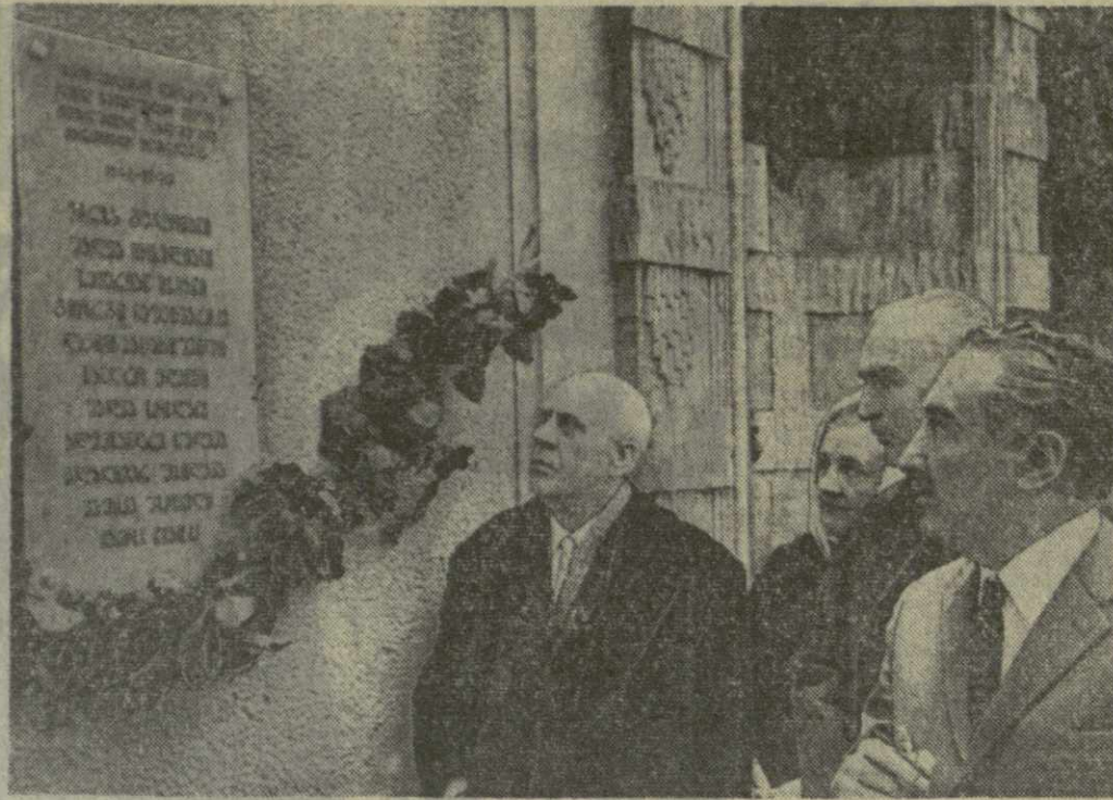
Этот снимок наш фотокорреспондент Г. Вахтагандзе сделала вчера в Союзе писателей Грузии во время митинга, посвященного открытию мемориальной доски. Друзья вспоминают павших героев — бойцов, тех, чьи имена бессмертны в памяти нашей, тех, чью строку оборвала пуля...

Музей боевой славы, организованный республиканским комитетом ДОСААФ, открылся в столице Грузии. Материалы, фотоснимки рассказывают об истории зарождения Советских Вооруженных Сил, о героизме гражданской и Великой Отечественной войны.