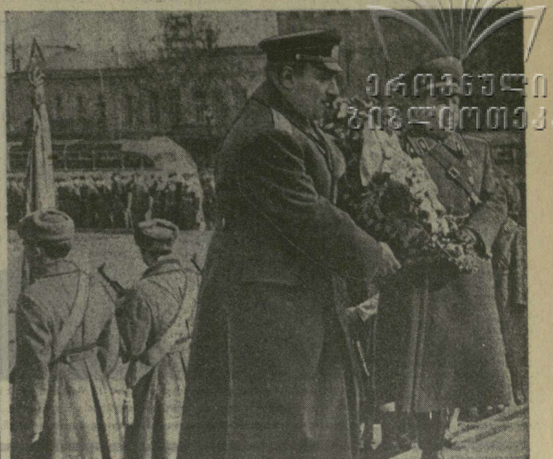
Вчера, в день 50-летия Вооруженных Сил СССР, представитель частей Тбилисского гарнизона пришел к памятнику В. И. Ленину, чтобы почтить память основателя Коммунистической партии и первого в мире социалистического государства, организатора Советской Армии и Военно-Морского Флота. На снимке: возложение венков к памятнику В. И. Ленину.

(Доклад был выслушан с большим вниманием и неоднократно прерывался аплодисментами).