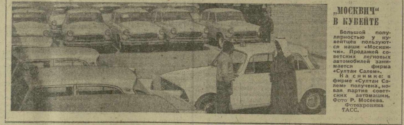
«МОСКВИЧ» В КУВЕНТЕ

Воздушную армию тяжелых транспортных машин, в числе которых были «Антеи», охраняли сверхзвуковые истребители.