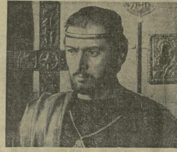
На снимке: кадр из фильма «Десница великого мастера».