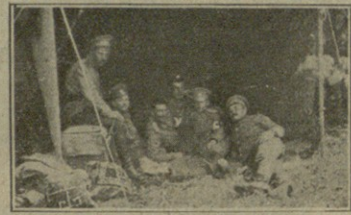
კავკასიის მსროლელთა ბრიგადის კამანდირი, ზარკის ბეთაღი და სანატარული ექიმები დ. ვიასნიდან გადიან.