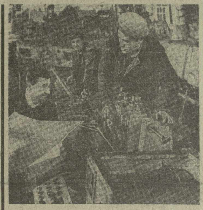
На Тбилисском станкостроительном заводе имени С. М. Кирова изо дня в день ширится соревнование за успешное выполнение заданий третьего года пятилетки.

У мамы двоих детей, сказала она. Я говорю от имени женщин — матерей делегатов нашего съезда. Я обращаюсь к американским матерям и матерям всей земли: не позволяйте посылать ваших сыновей на грязную войну во Вьетнаме. Помните, что ваши сыновья погибнут в этой войне как убитые старики, детей, женщин.