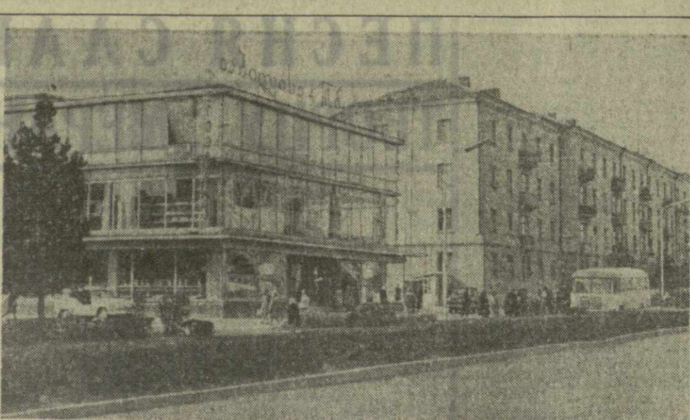
Рустави. На снимке: универсам «Тбилиси» на проспекте Дружбы.