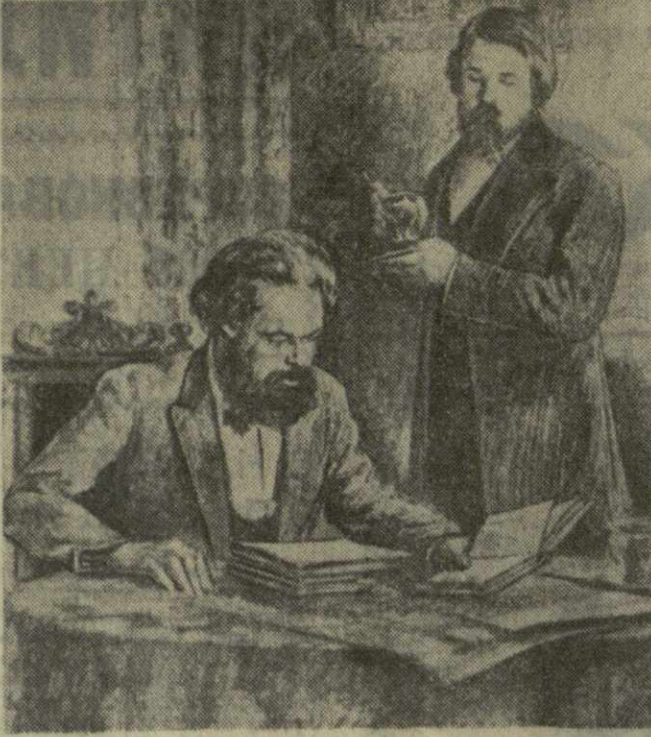
К. МАРКС И Ф. ЭНГЕЛЬС ЗА РАБОТОЙ.

ГЛУБОКО веря в революционные силы рабочего класса, Маркс в то же время трезво оценивал всю длительность, сложность и противоречивый характер мирового революционного процесса. Обращаясь к рабочим, Маркс писал: «Вам, может быть, придется пережить еще 15, 20, 30 лет гражданских войн и международных столкновений не только для того, чтобы изменить существующие условия, но и для того, чтобы изменить самих себя и сделать себя способными к политическому господству...»