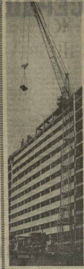
Быстрыми темпами ведется строительство одного из крупнейших в Грузии лечебных центров — республиканской клинической больницы в Тбилиси. На снимке: один из участков строительства.