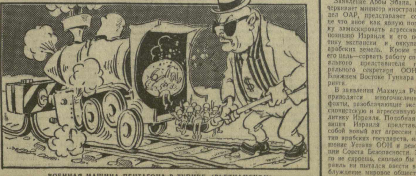
Военная машина пентагона в тупике (Вьетнамском). Рис. А. Кандаджи.