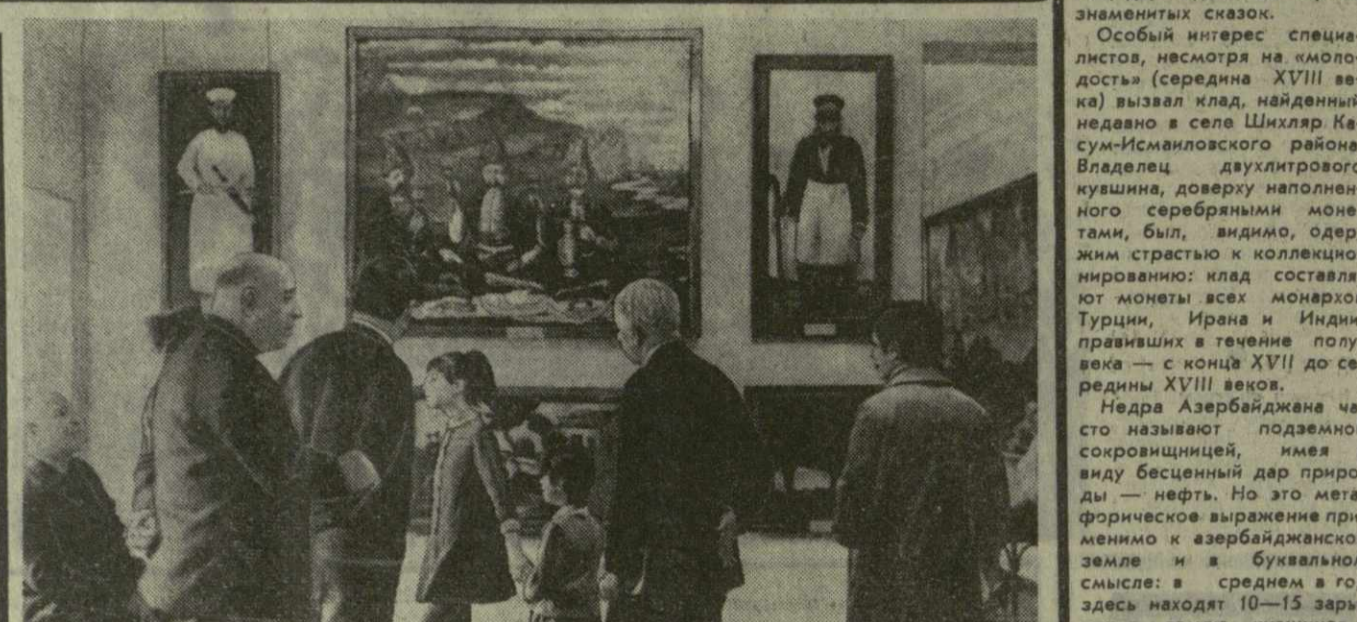
Пиросмани... Для тех, кому дорого искусство, это имя говорит о многом. Его картины оригинальны и неповторимы — они рассказывают о трудной жизни большого художника, его творчестве, озаренном всероссийскими порывами вдохновения... Многолюдно столели в залах Государственного музея искусства Грузии, где экспонируются работы Пиросмани. На снимке: один из уголков выставки.