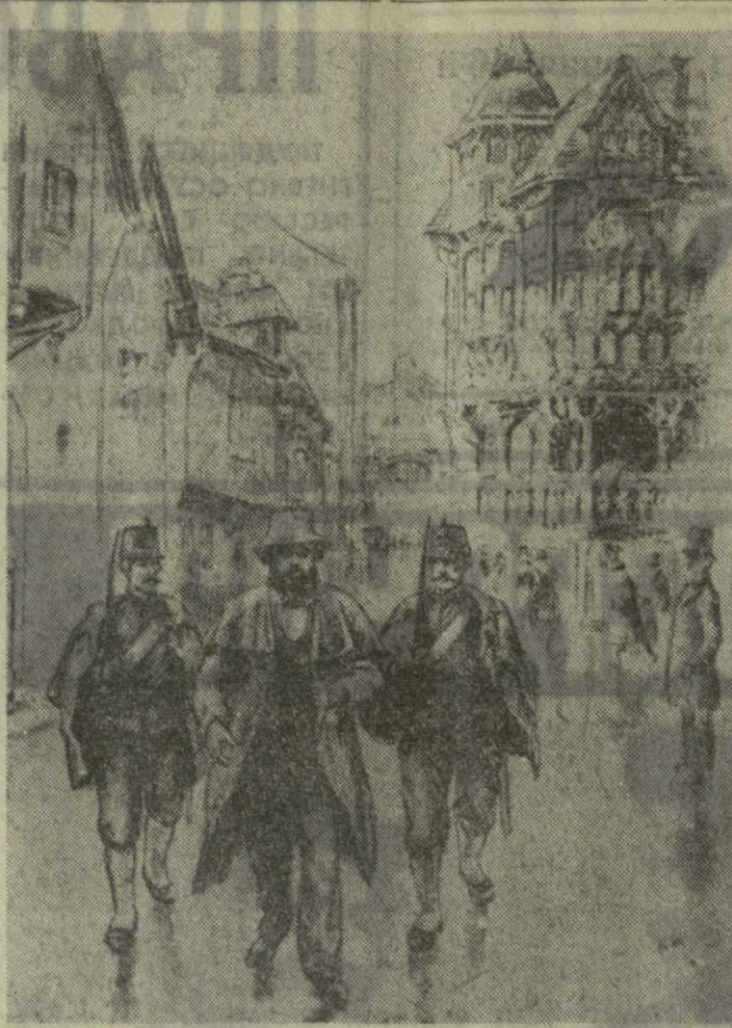
«Арест в Брюсселе». 1847 г. Рисунок Н. Жукова.

Великая Октябрьская социалистическая революция и весь последующий мировой революционный процесс в целом, а также успехи и неудачи революционной борьбы в отдельных странах неопровержимо доказали, что роль передового борца может выполнять лишь партия, которая руководствуется революционной теорией марксизма-ленинизма. Еще на заре российского рабочего движения Ленин необычайно точно выразил революционную сущ-