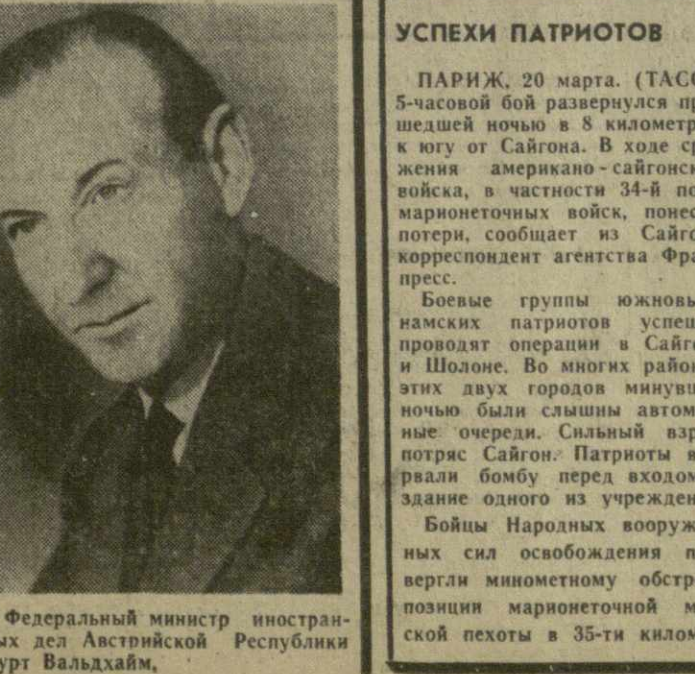
Федеральный министр иностранных дел Австрийской Республики Курт Вальдхайм.

21 марта в Тбилиси прибывает федеральный министр иностранных дел Австрийской Республики д-р Курт Вальдхайм, находящийся в Советском Союзе по приглашению министра иностранных дел СССР А. А. Громыко. К. Вальдхайм родился в 1918 г. Окончил Консульскую академию и юридический факультет Венского университета. Поступив на дипломатическую службу после окончания второй мировой войны, занимал ряд ответственных постов в Министерстве иностранных дел и дипломатических представительствах Австрии за рубежом. Был послом Австрии в Канаде, начальником Политического управления МИД Австрии, постоянным представителем Австрии при ООН. С января 1968 г. — министр иностранных дел. Визит министра иностранных дел Австрийской Республики будет содействовать дальнейшему развитию дружественных отношений между Советским Союзом и Австрией. (ГрузТАГ).