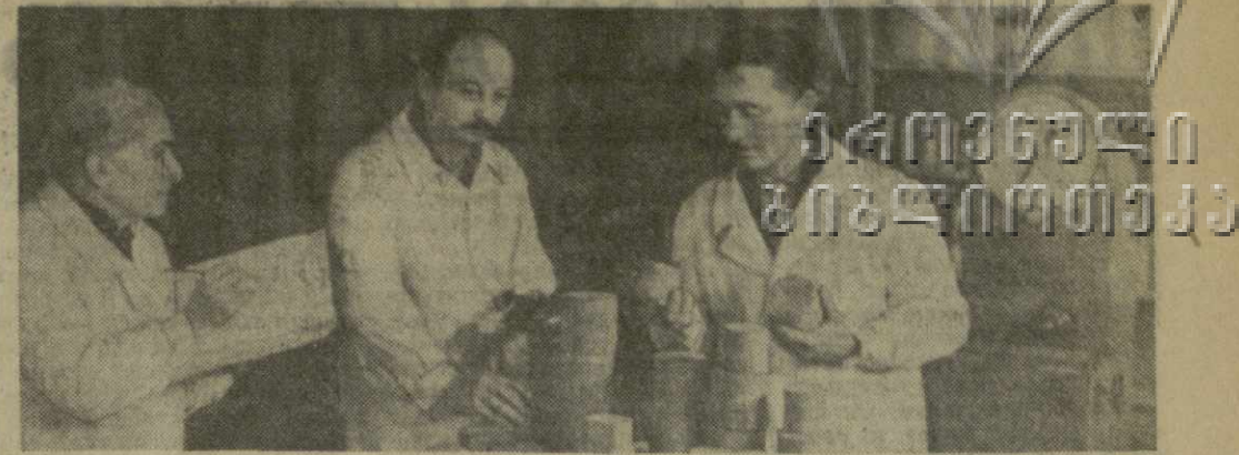
Лаборатория физики горных пород Института горной механики, разработки месторождений и физики взрыва имени Г. А. Цулукидзе Академии наук Грузинской ССР занимается исследованием механических и технологических свойств руд, необходимых для выбора оптимальных способов добычи и крепления горных выработок.

Совет призван в первую очередь способствовать повышению общественной активности научной молодежи, организовывать дискуссии по разным вопросам науки. Нынешний семинар — первый опыт в этом направлении. И, если судить по двум первым дням работы, можно считать, что этот опыт встречи молодых ученых, работающих в различных областях науки, удался.