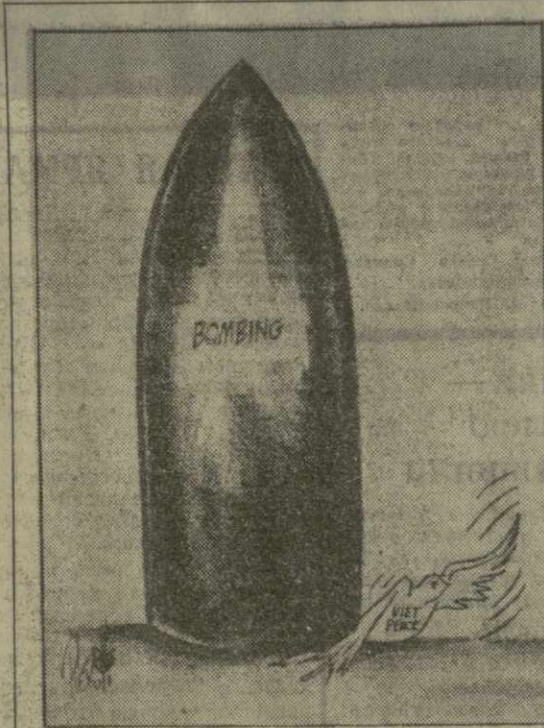
Такова реакция Вашингтона на призывы прекратить бомбардировки ДРВ и начать переговоры о мирном урегулировании вьетнамской проблемы. (Карикатура из американской газеты «Нью-Йорк пост»).

Широкие слои населения и даже церковь осуждают репрессии и кровавый террор. Архиепископ Марио Касарiego назвал их «страшными преступлениями». Террористическая лига не раз грозила ему расправой. Позавчера он был похищен на одной из улиц гватемальской столицы. Тем не менее, именно похищение архиепископа было использовано в качестве предлога для введения осадного положения.