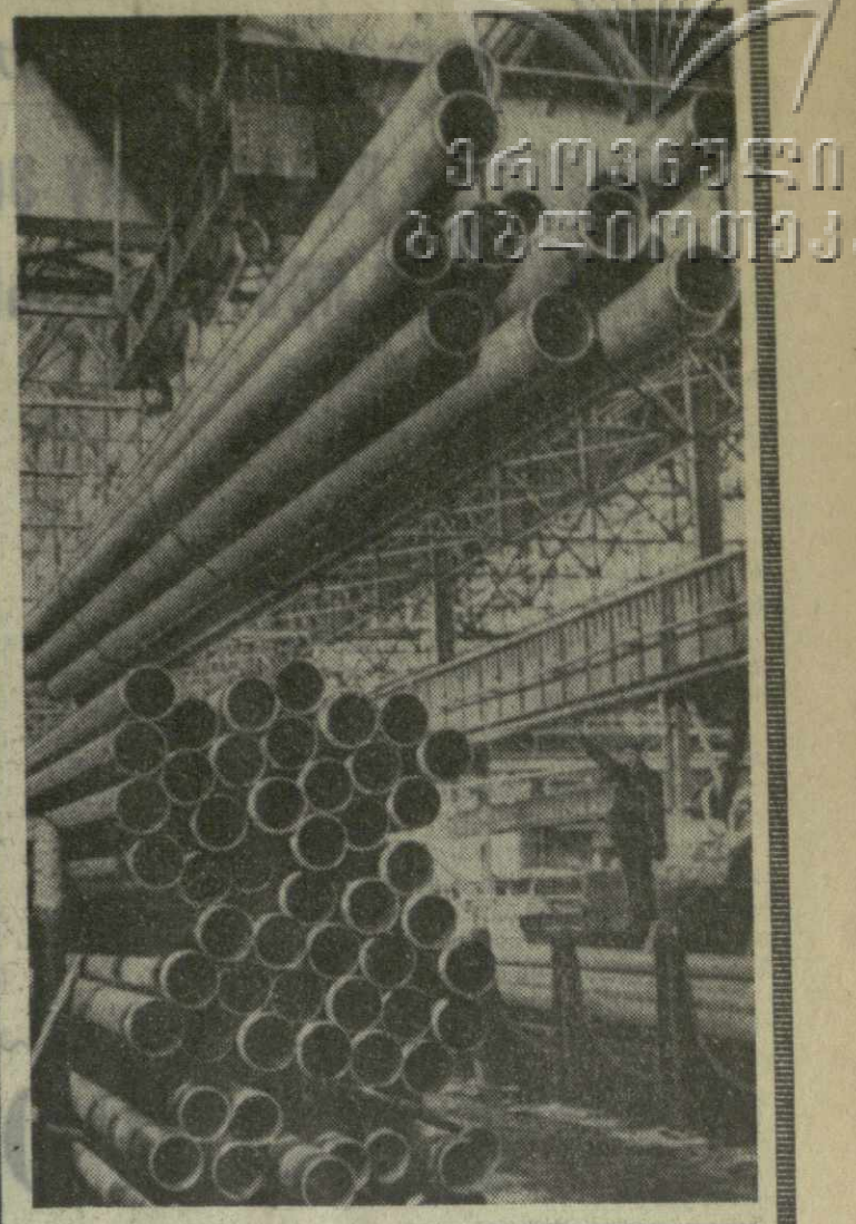
Коллектив Руставского металлургического завода...