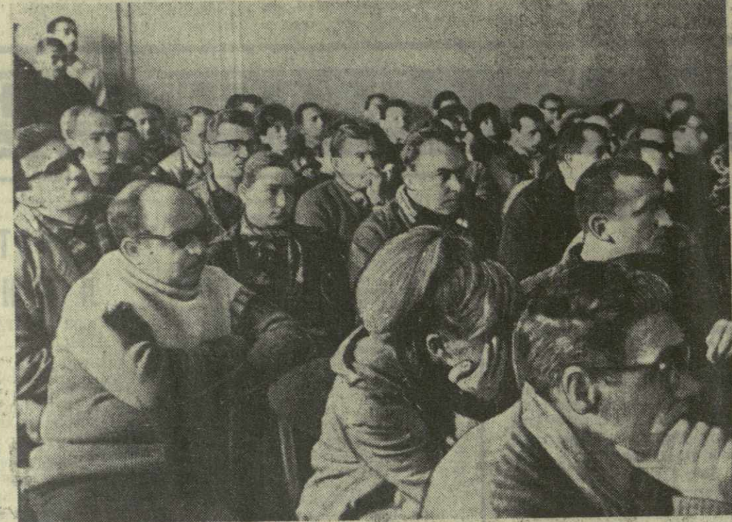
На бакурианском семинаре молодых научных работников Грузии.

останется в памяти на долгие годы. Что касается профессионального интереса, то он нашел в дни семинара определенное удовлетворение.