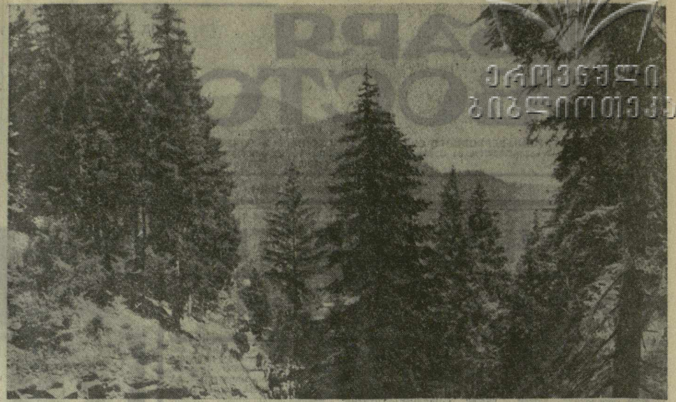
На снимке: лесной массив в Кечоби Боржомского района.

Премии присуждаются постановлением Совета Министров Грузинской ССР по представлению Республиканской чрезвычайной комиссии по борьбе против большого елового лубоеда. (ГрузТАГ).