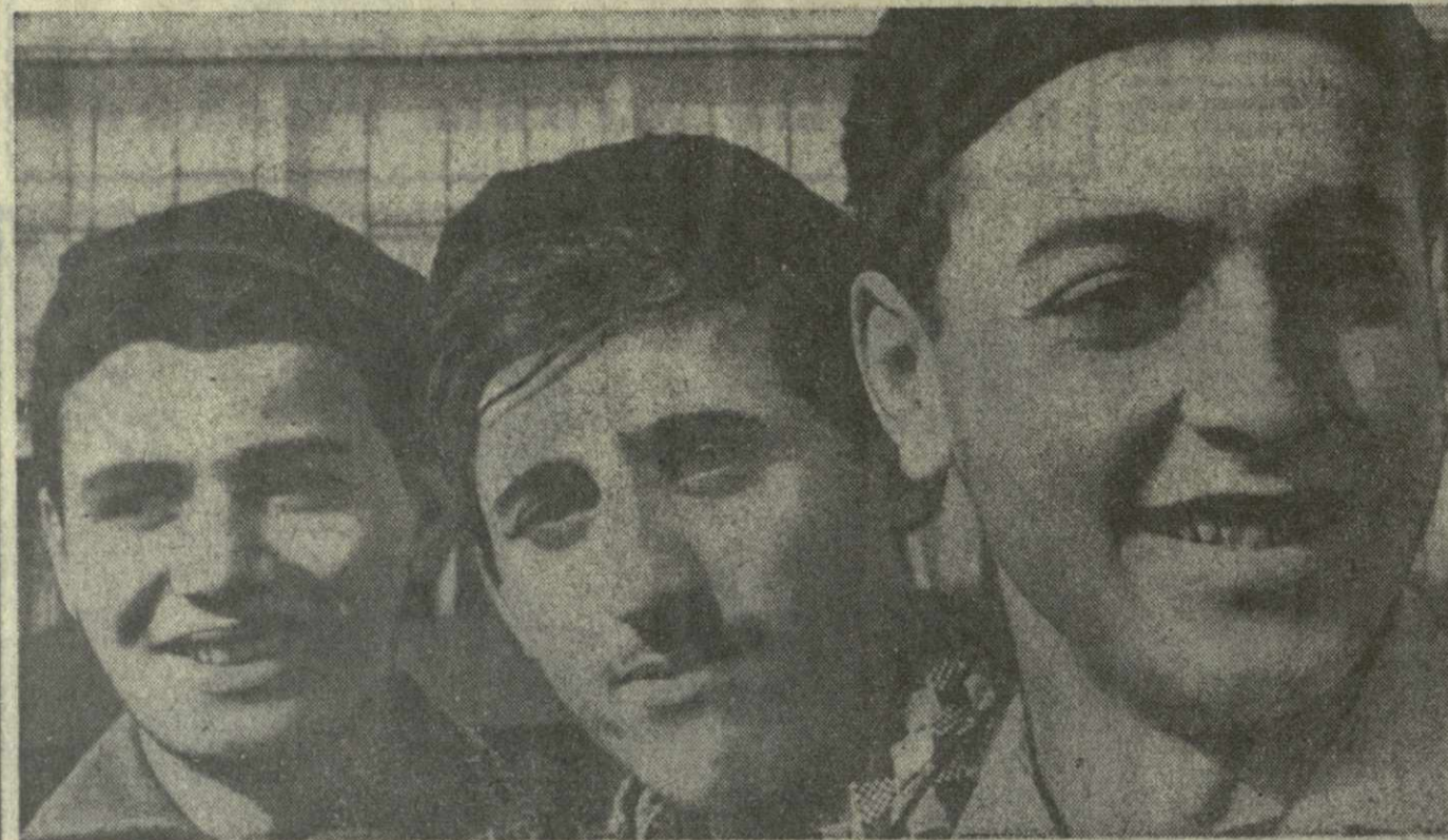
Эти веселые юноши — учащиеся Тбилисского строительного профессионального училища № 18. Они сехались в столицу Грузии из разных уголков республики, чтобы освоить специальность строителей...

И. ХАЧИДЗЕ, общественный корреспондент «Заря Востока».