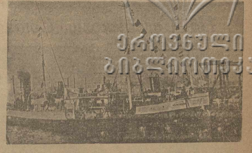
БАКУ. Нефтяное судно «Номс мол» готовится к выходу в море.

Ватум. Реальная экономия. Ватум. Реальная экономия.