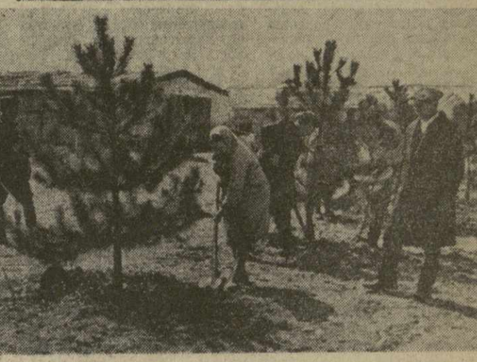
На снимках: сверху — идет реконструкция животноводческой фермы. Внизу — рабочие совхоза озеленяют территорию вокруг фермы.