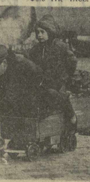
Век атома магическая сила пара все еще захватывает воображение некоторых людей. Эту копию первого трактора с прицепом можно видеть на улицах английского города Ист-Гринстида. И трудно сказать, кто больше получает удовольствия от такого путешествия: отец — создатель этой забавной машины или сын.