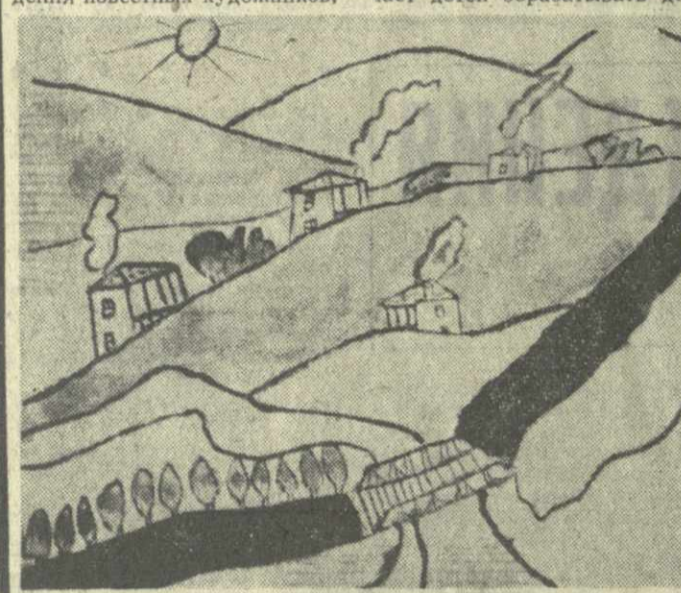
На снимках: (сверху вниз) «Сельский пейзаж» — рисунок Бади Мекуашвили...