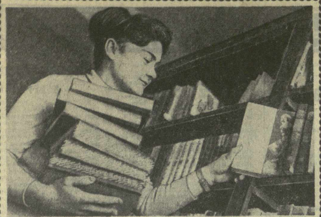
Колхоз «Сакартвелос» села Котара...