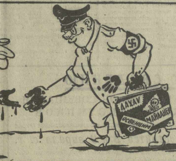
КРОВНОЕ РОДСТВО. Рис. А. Канделак.

Некоторые пазухи из газетовских лагерей смерти в массовое время являются компаньонами кооплабелей у родезийского обер-реставра Смита. (Из газет)