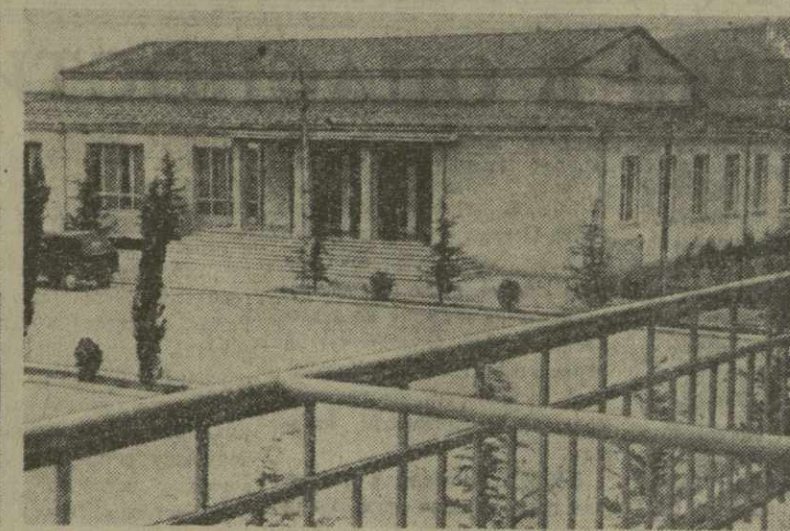
На снимках: слева — центральная усадьба Варкетильского виноградарского совхоза. Справа — Дом культуры.