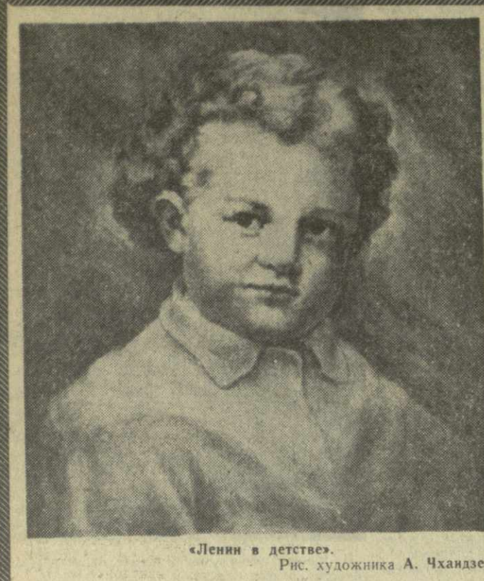
«Ленин в детстве». Рис. художника А. Чхатадзе.