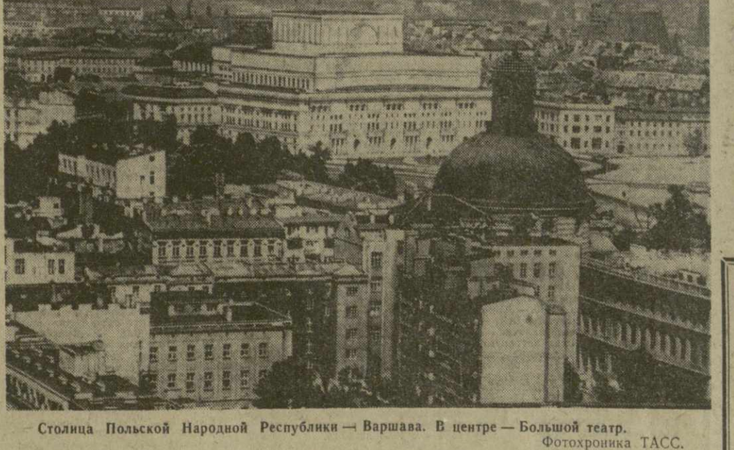
Столица Польской Народной Республики — Варшава. В центре — Большой театр.

Отмечая знаменательную дату — 23-ю годовщину советско-польского Договора, советские люди от всей души желают братскому польскому народу дальнейших успехов на его славном пути строительства социализма, борьбы за мир во всем мире. С. ЭЛИАШВИЛИ.