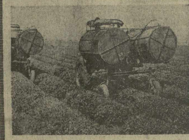
Колхоз имени Карла Маркса села Пичвარი Кобулетского района — один из передовых хозяйств республики. Из года в год здесь получают высокие урожаи чайного листа. В колхозе широко применяют механизмы на сборе чайного листа и обработке плантации. На с/м в колхозе тракторы «Т-16» на чайных плантациях. Фото Н. Анастасьева. (Фотохроника ГРУЗТАГ).