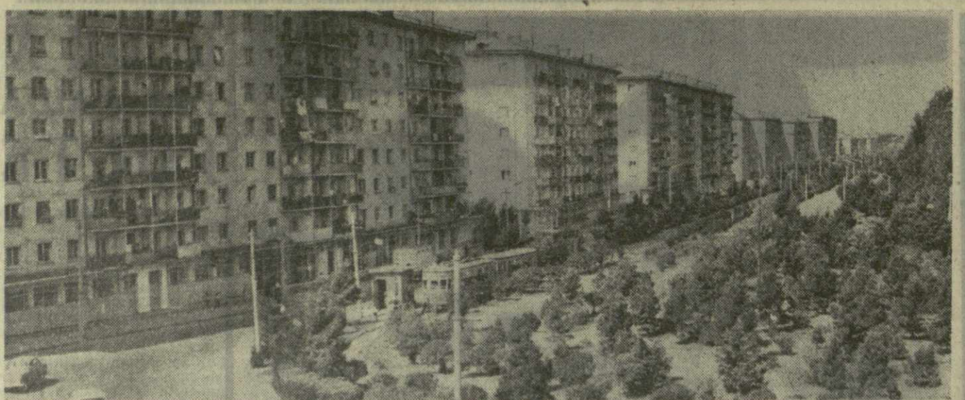
Тбилиси. Одна из самых молодых магистралей города — Московский проспект.

ЛАГОДЕХИ. Леса занимают в районе 40,600 гектаров. И тем не менее здесь ведется большая работа по закладке новых насаждений. За последние десятилетия искусственные леса появились на площади 2,058 гектаров. В нынешнем году закладки будут произведены на 200 гектарах.