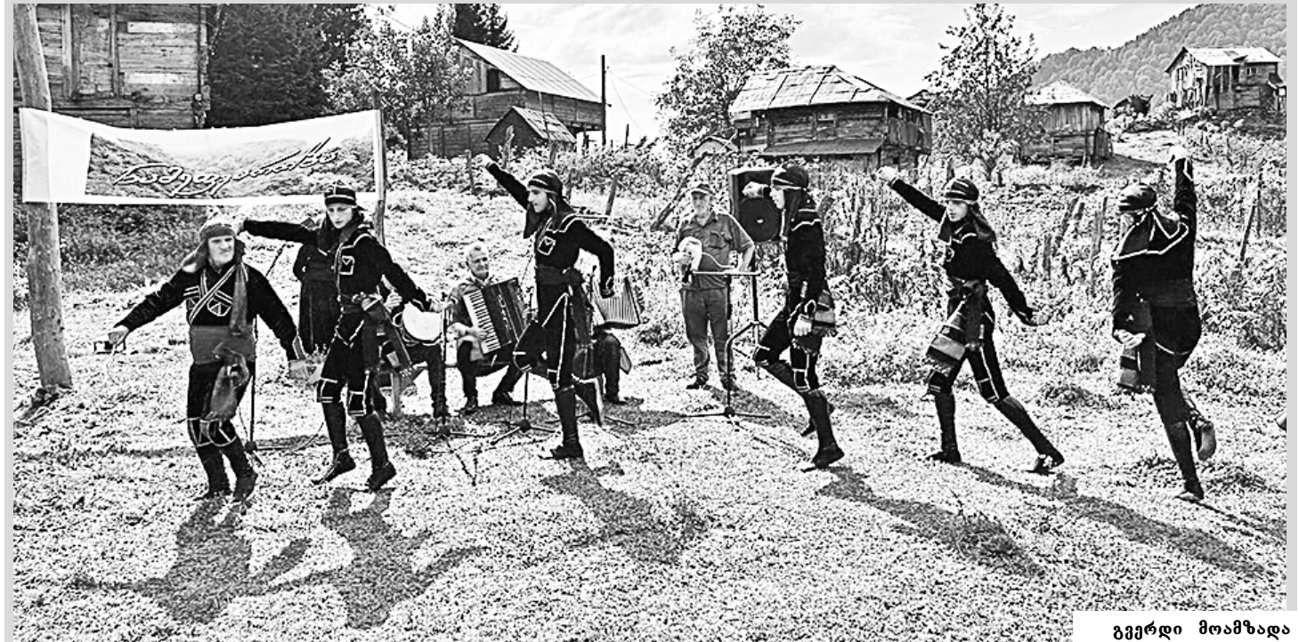
გვერდი მოამზადა ომარ ცინცაძემ

ღონისძიება ქელის კულტურის ცენტრის მიზნობრივი პროგრამის ფარგლებში გაიმართა.