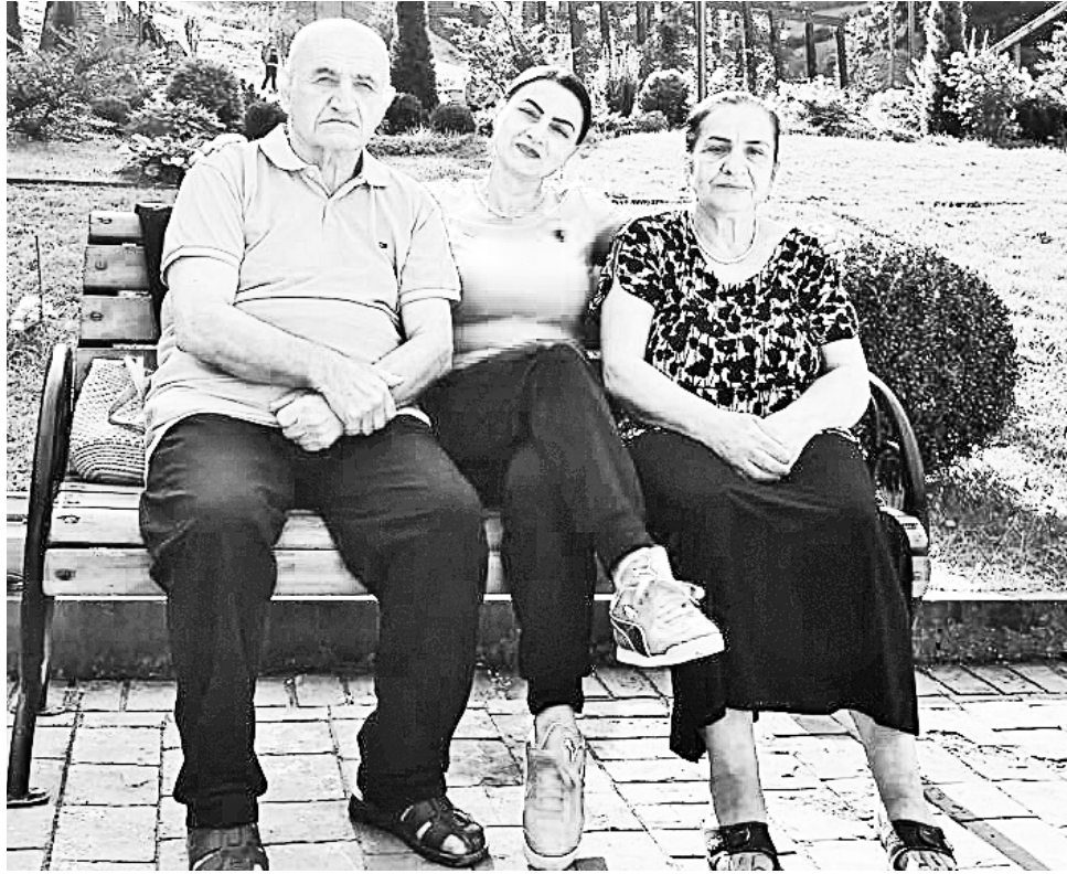
ალმაშენებლის წერის პერიოდს, შემოდის თამამად გათხრათ, რომ ყველაფერი ნათლად მახსოვს, მიუხედავად იმისა, რომ საკმაოდ პატარა ვიყავი. დედა ხელნაწერს კარნახობდა, მამა საბეჭდო მანქანასთან იჯდა და ტექსტს

- მამა ჩემთვის განსაკუთრებული ადამიანი იყო და არის. მისი დიდი რიდი, პატივისცემა და სიყვარული მაქვს. ის ჩემთვის ავტორიტეტია - ნიჭიერი მწერალი, პოეტი, უაღრესად მზრუნველი და მოსიყვარულე ადამიანი. რაც თავი მახსოვს, ყოველთვის დიდი მეგობრები ვიყავით და ვართ. მას აქვს სიყვარულის, მისი გამოხატვის საოცარი ნიჭი და უნარი. მასთან ნებისმიერ თემასა და საკითხზე შეიძლება საუბარი. დღემდე მაძლევს მამაშვილურ, კოლეგიალურ და პროფესიულ რჩევებს, რასაც ვითვალისწინებ და სასურველ შედეგსაც ვაღწევ. ვინც გვიცნობს, ყველამ იცის ჩვენი ძალიან სათუთი ურთიერთობების შესახებ. მასთან გატარებული ყოველი წუთი შინაარსით და სიყვარულით სავსეა, მაგრამ გამოვყოფ რამდენიმე ეტაპს. გავიხსენებ სკოლის პერიოდს, როდესაც ვაკვთობდით შორის შესვენებაზე შემომივლიდა მოულოდნელად, გულში ჩამიკრავდა, ტკბილედ უღიჟღავნებდა და გემრიელობებით ამივსებდა ხელს და მეტყულებდა: მომენატრე, ჩემო კუდრაჭა. საღამოობით ფანდურს ჩამოჭრავდა და ხალხ-