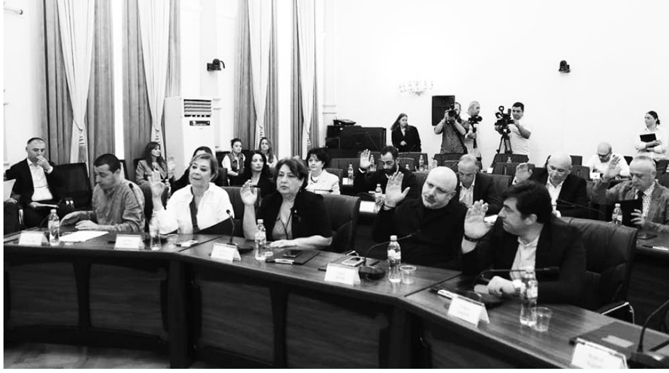
„ერთიან ნაციონალურ მოძრაობას“ წარმომადგენელი