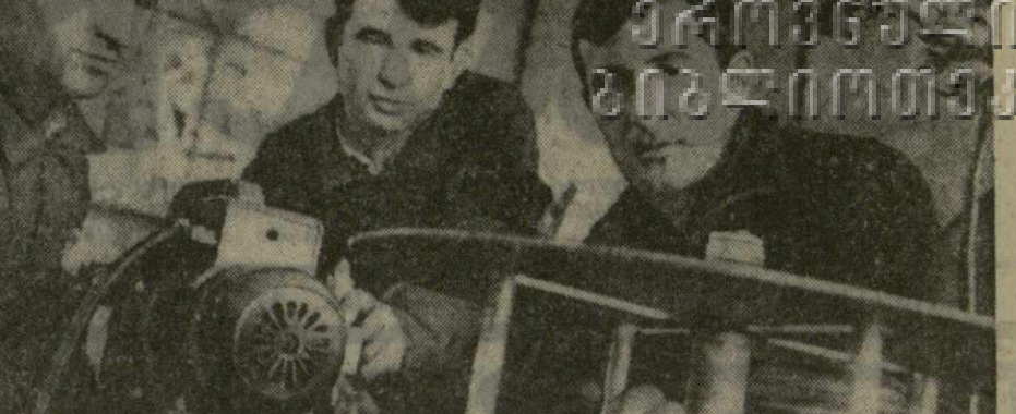
Высоких трудовых показателей добивается в третьем году пятилетки коллектив тбилисского завода «Электросарка». Взят повышенные обязательства выпустить в этом году сверхплановой продукции на 12.000 рублей, труженики завода с честью выполняют свое слово.

Научными работниками и опытной станцией разработана и уточнена система научных мероприятий по борьбе с виноградными паутинными клещом, а также с вредителями и болезнями плодовых деревьев. Эти мероприятия широко проводятся в хозяйствах района.