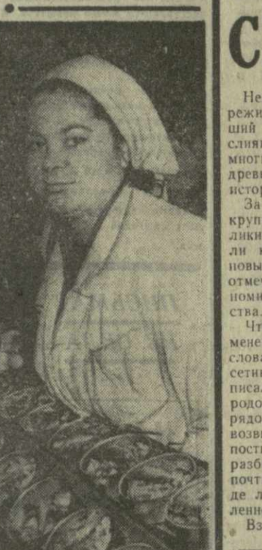
Доброй славой пользуется у потребителей продукция Социального рыбокомбината. Умельца, которую вы видите на снимке, одна из тех, что прилагает максимум усилий, чтобы на прилавках магазинов было вдоволь вкусных консервов, копченой рыбы и т. п. План она реализует на 140-160 процентов.

Честность, нравственность и справедливость — неотъемлемые свойства внешней политики социализма. В. И. Ленин указывал, что классы обмануть нельзя, что пролетариат нуждается только в правде, что для него нет ничего вреднее, чем ложь, что советская политика чужда хитростям и обману, что слово у нее не расходится с делом.