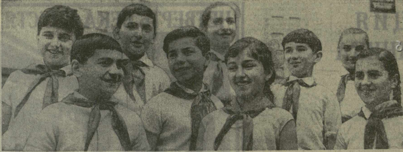
На снимке: группа пионеров 4-й тбилисской средней школы Ленинского района.