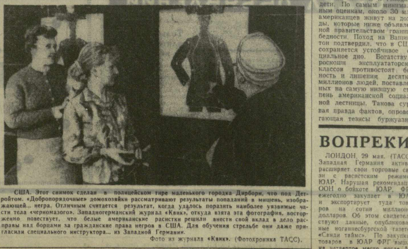
США. Этот снимок сделан в полицейском тире маленького городка Дирборн, что под Детройтом. «Добропорядочные» домохозяйки рассматривают результаты попаданий в мишень, изображающей «Негра. Отличным считается результат, когда удалось поразить наиболее уязвимые части тела «негрозомого». Западногерманский журнал «Канк», откуда взята эта фотография, воспринимает похвастать, что белые американские расистки решили изменить свой вклад в дело расизма над борцами за гражданские права негров в США. Для обучения стрельбе они даже пригласили специального инструктора... из Западной Германии.