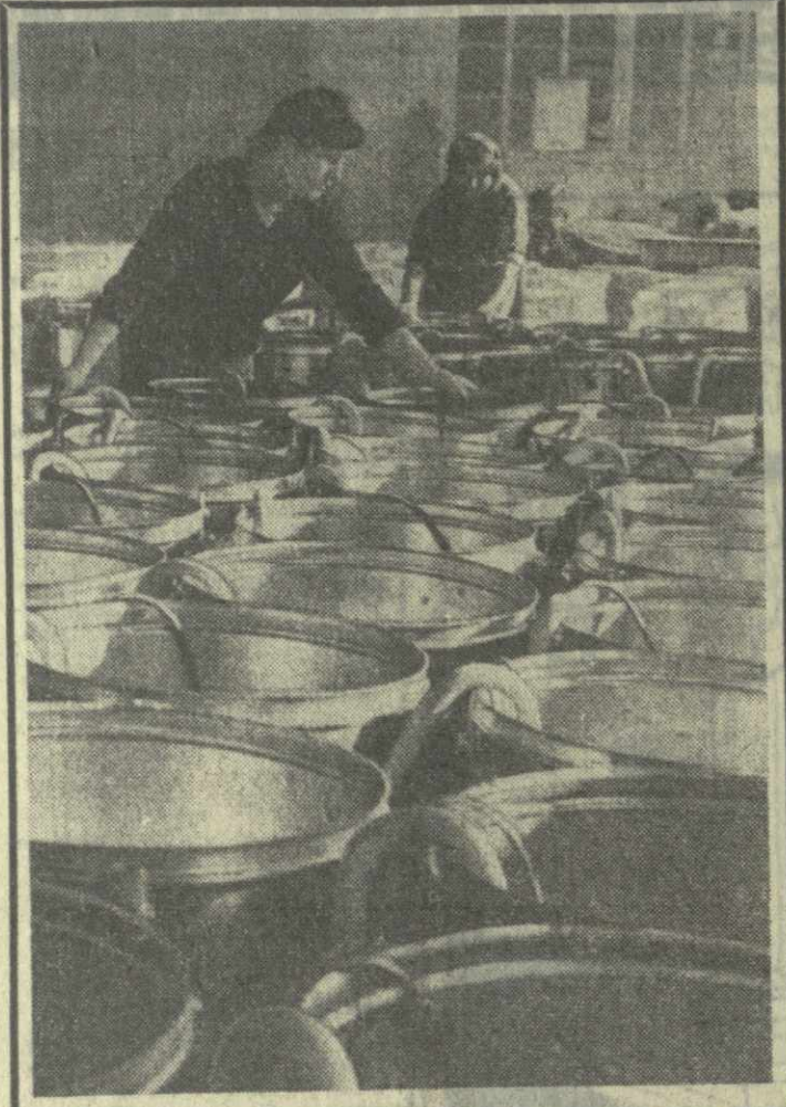
Батумский электротехнический завод — одно из крупнейших предприятий, занимающееся выпуском бытовых машин. В этом году завод выпустит на 20 тысяч стиральных машин больше, чем в минувшем году.

Монтаж дома-гиганта начался в столице Советской Белоруссии. Он состоит из шести 9-этажных секций, вмещающих в себя 323 квартиры общей площадью около 9 тысяч квадратных метров.