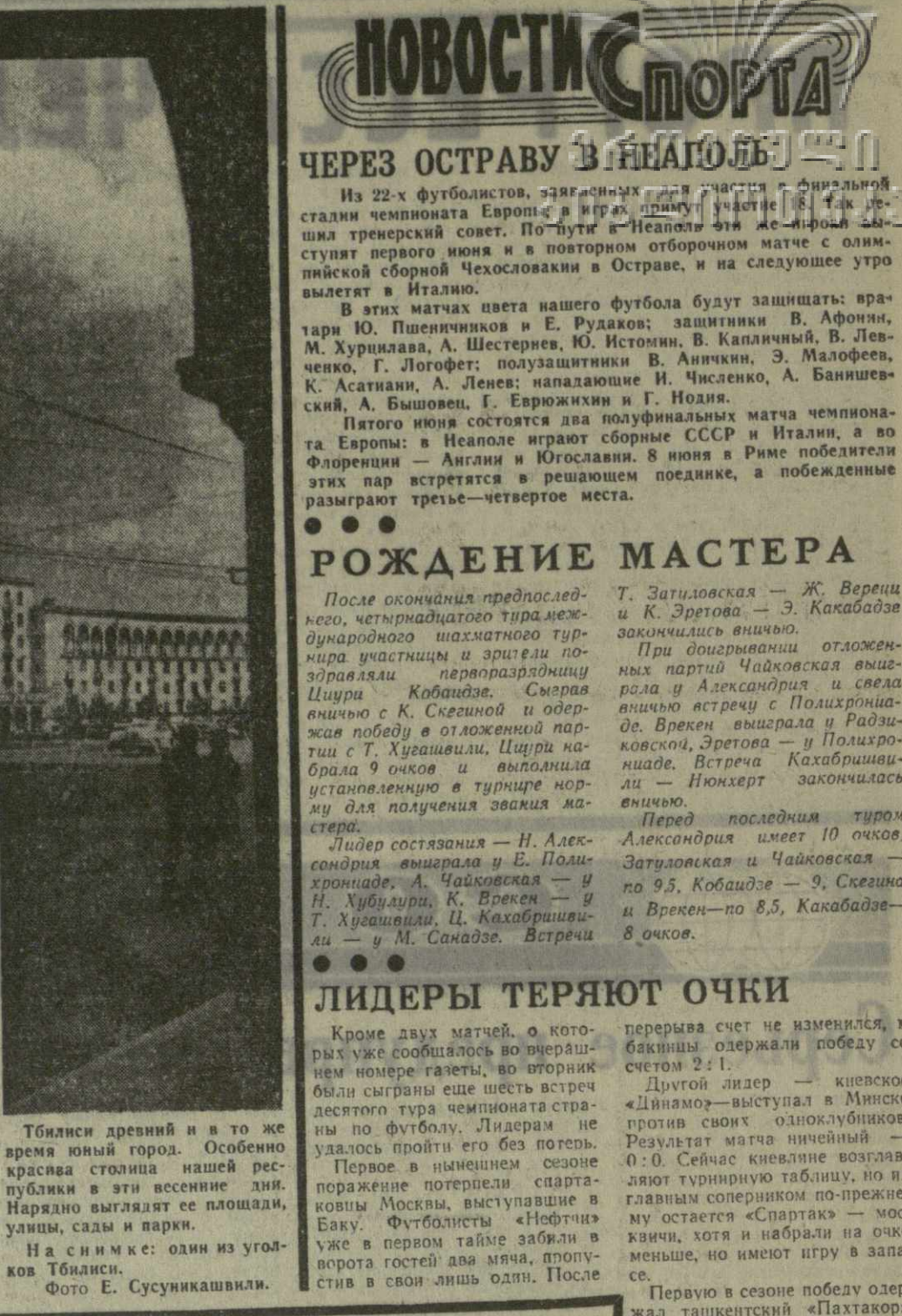
Тбилиси древний и в то же время юный город. Особенно красива столица нашей республики в эти весенние дни.

Кроме двух матчей, о которых уже сообщалось во вчерашнем номере газеты, во вторник были сыграны еще шесть встреч десятого тура чемпионата страны по футболу.