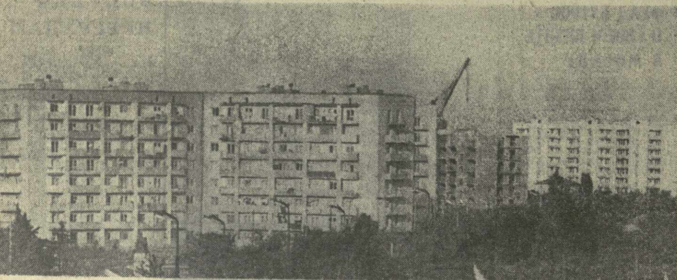
Из года в год Кутаиси благоустраивается и хорошеет. На снимке: новые восьмиэтажные дома на пересечении улиц Автозаводской и Горькой.