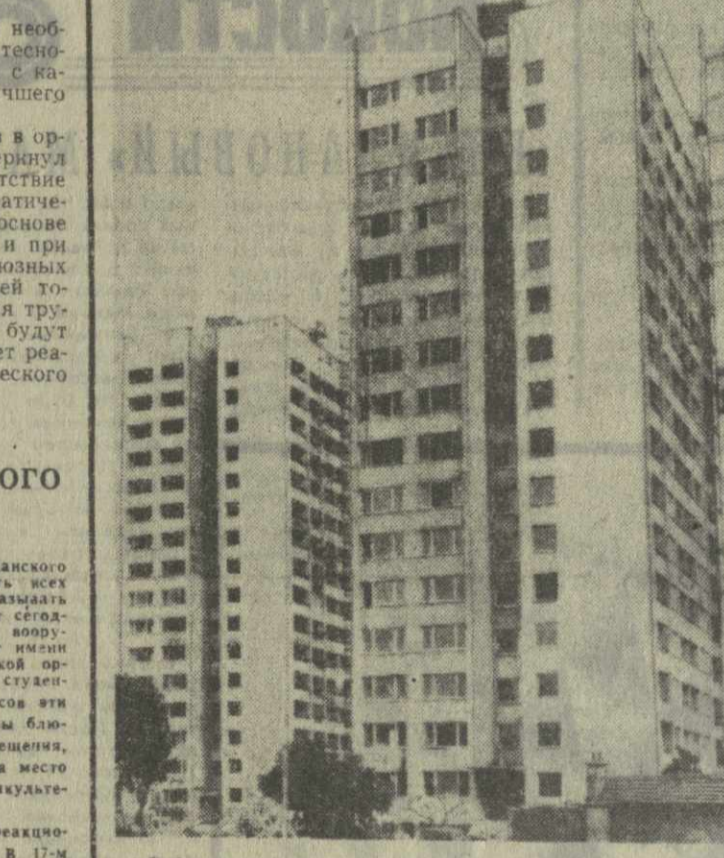
В болгарской столице идет усиленная подготовка к достойной встрече посланцев на IX Всемирный фестиваль молодежи и студентов, в котором примут участие более 120 стран.

● В той же газете ДЖЕЙМС РЕСТОН ПРИЗНАЕТ, ЧТО ГОЛОС ИЗБИРАТЕЛЕЙ НА ВЫБОРАХ В США ФАКТИЧЕСКИ НЕ БУДЕТ ИГРАТЬ СУЩЕСТВЕННОЙ РОЛИ — ВСЕ БУДЕТ РЕШЕНО Т. Н. ПАРТИЙНЫМИ МАШИНАМИ. КАНДИДАТЫ, ОТМЕЧАЕТ РЕСТОН, «ИЗБИРАЮТСЯ В ОСНОВНОМ ВТЕМНУЮ ДЕЛЕГАТАМИ, КОТОРЫЕ НЕ ИЗБРАНЫ НАРОДОМ И НЕ ОБЯЗАТЕЛЬНО ЕГО ПРЕДСТАВЛЯЮТ». (ТАСС).