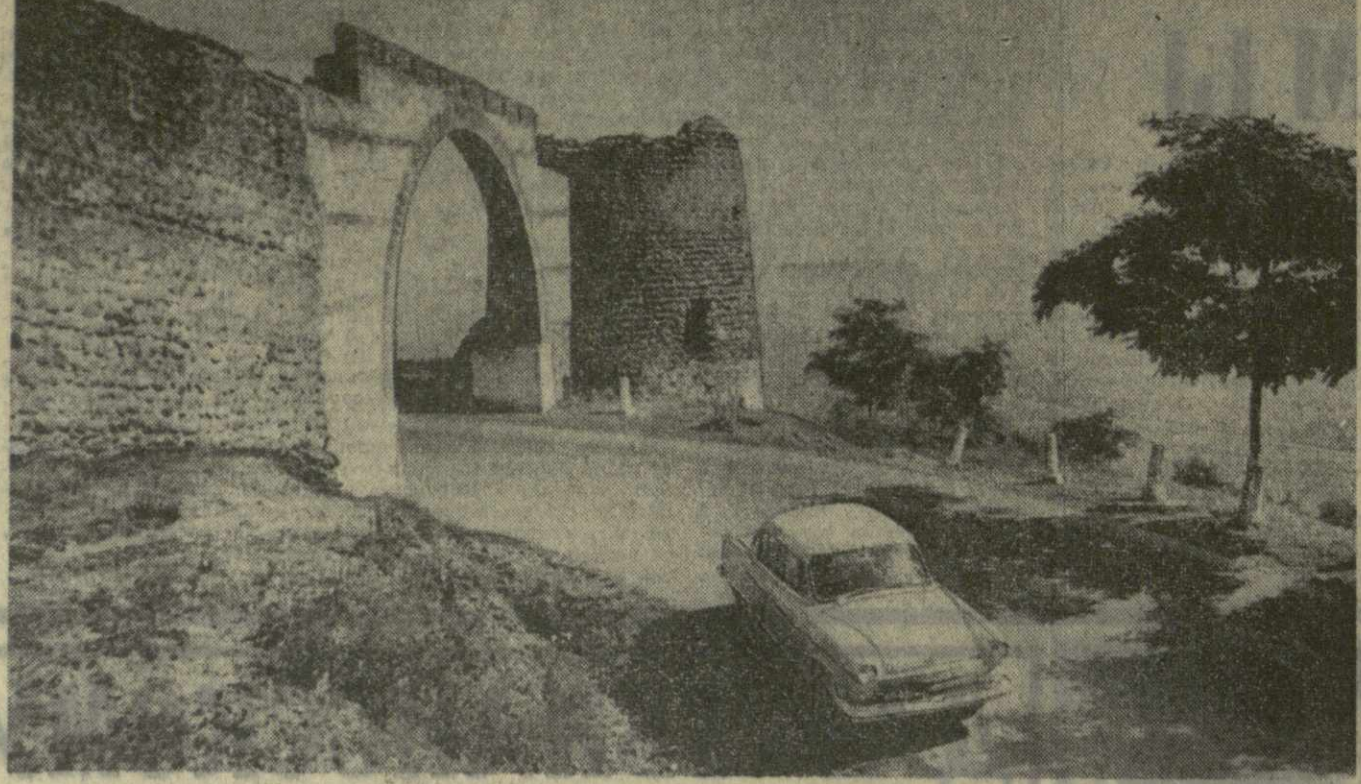
О многом могли бы поведать камни этой древней стены у города Сигнахи — свидетели глубокой старины, революционных Сурь и счастья советской действительности.

ШИРОКО РАЗВЕРНУТО ШКОЛЬНОЕ СТРОИТЕЛЬСТВО в Цителцарском районе. Сейчас в селе Каемо-Кеди строится средняя школа, а в Озавни — восьмилетняя.