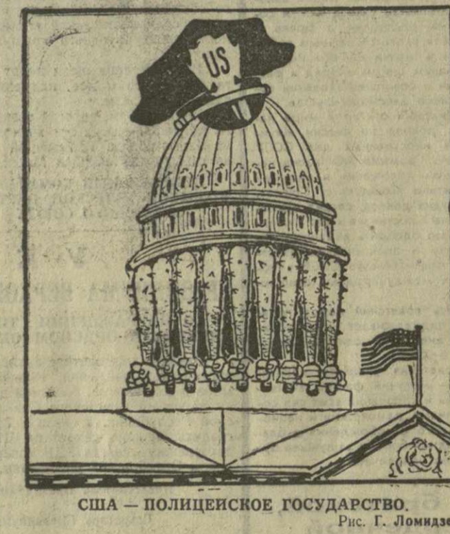
США — ПОЛИЦЕЙСКОЕ ГОСУДАРСТВО. Рис. Г. Ломидзе.

Американская полиция арестовала 200 человек бедняков, участников похода на Вашингтон, и их лидера, руководителя похода священника Ральфа Абернети.