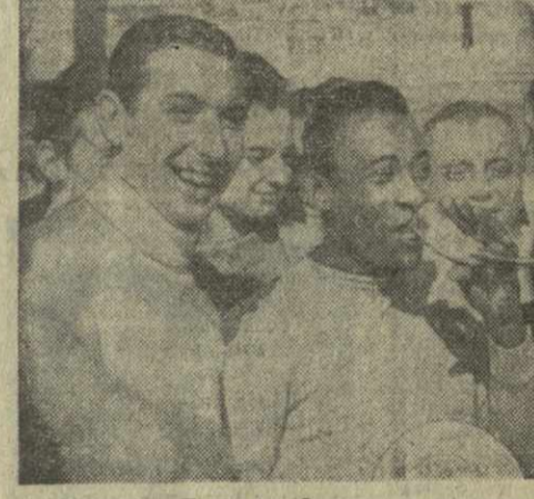
Встреча с Пеле в г. Сантосе на стадионе футбольного клуба «Сантос».