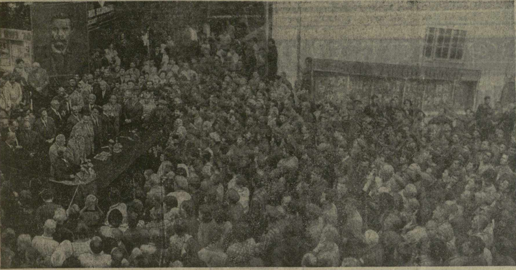
На снимке: обще заводской митинг на Тбилиском паровозо-вагоноремонтном заводе, посвященный 100-летию со дня рождения Максима Горького.

МИТИНГ НА ЗАВОДЕ, ГДЕ РАБОТАЛ МАКСИМ ГОРЬКИЙ