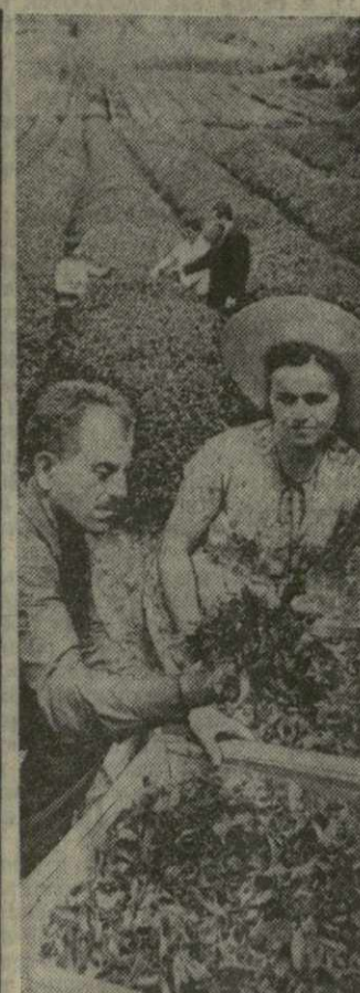
На зеленых плантациях Цхакваского района в разгаре чайная страда. Успешно ведут сбор высококачественного листа во многих зеленых хозяйствах. Отлично обстоит дело и у колхозников села Ушанати, достойно ведущие трудовую работу третьего года пятилетки. Чаводы артези, при годовом плане 280 тонн, уже получили свыше 200 тонн ценного сырья.

Важное значение имеет умелое распространение и обновление опыта передовиков, новаторов производства. Значительная работа в этом направлении проводится на руднике имени Димитрова треста «Чхатармаргаче». Недавно