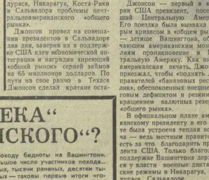
Рис. Г. Ломидзе.