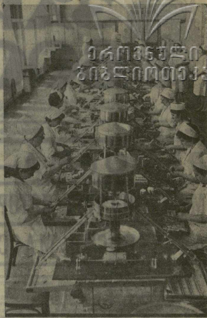
На Тбилиском химико-фармацевтическом заводе широко развернулось социалистическое соревнование за достойную встречу знаменательной даты — 100-летия со дня рождения В. И. Ленина.

ПРИНЯТО ВСЕСОЮЗНЫМ СЪЕЗДОМ УЧИТЕЛЕЙ 4 ИЮЛЯ 1968 ГОДА.