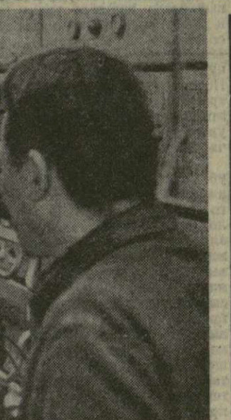
Список жертв американской атомной бомбардировки ведется японскими органами за последние годы. Среди жертв — жители Хиросимы и Нагасаки. Он состоит из 18 книг. В их списках записаны имена более 82 тысяч человек, которые скончались от последствий радиационного облучения или погибли в результате атомной бомбардировки, что подтверждается документально в послевоенные годы.