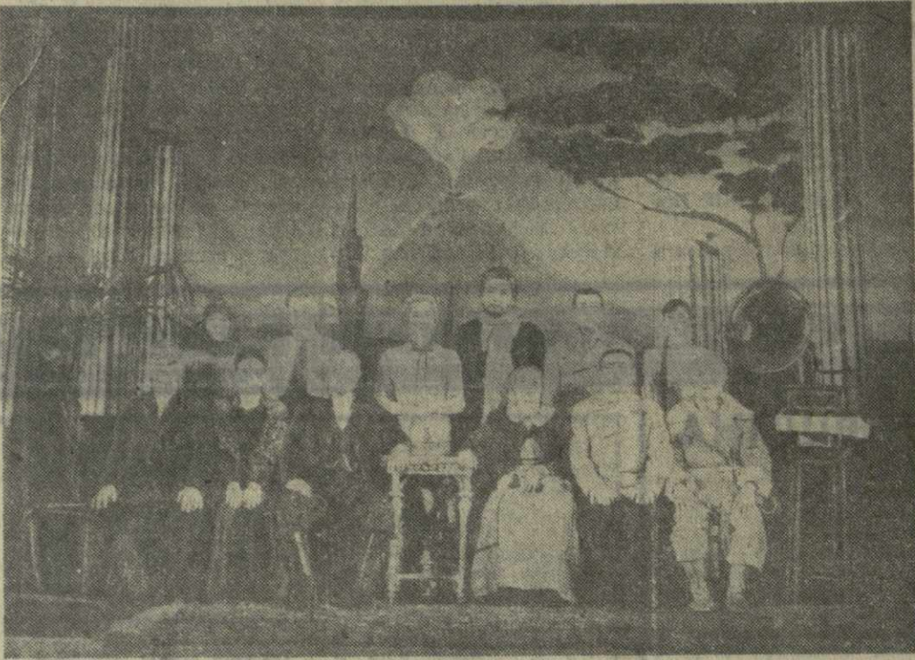
Вот он, мир Бессеменовых... Так начинается спектакль «Мещане» на сцене театра имени Руставели.