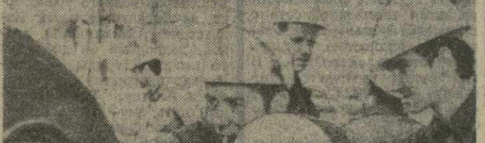
Элленгоггенштадт (ГДР). На металлургическом комбинате «Ост» в эксклюзивно первая очередь производственного комплекса холодильной прокатки стального листа готовой производительности в 800 тысяч тонн. Этот промышленный объект, входящий в число десяти важнейших новостроек ГДР, сооружен при техническом содействии Советского Союза.

Большое число американцев разделяют мнение о том, что вооруженное вмешательство США во Вьетнаме нельзя оправдать ни моральными соображениями, ни даже интересами национальной безопасности.