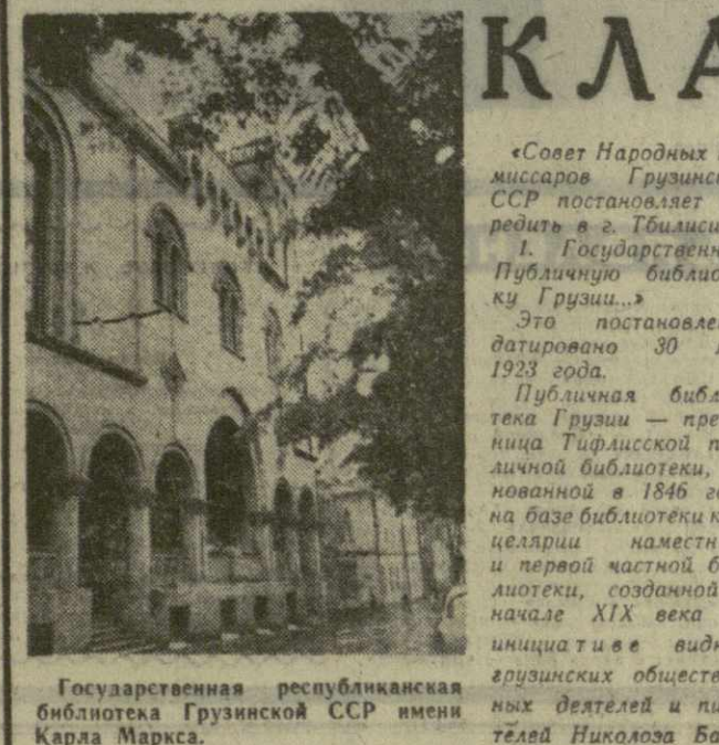
Государственная республиканская библиотека Грузинской ССР имени Карла Маркса.

На экранах тбилисских кинотеатров начал демонстрироваться новый фильм «Красные дьяволя-