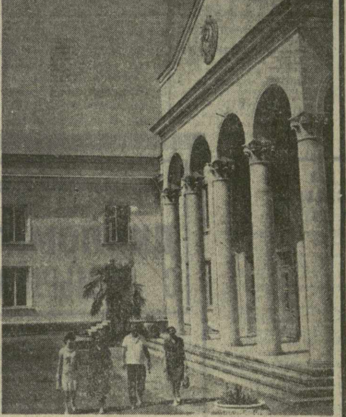
Недавно в село Руши Зугдидского района правление колхоза «Светлый» построило новый Дом культуры со зрительным залом на 800 мест.

На снимке: новый Дом культуры.