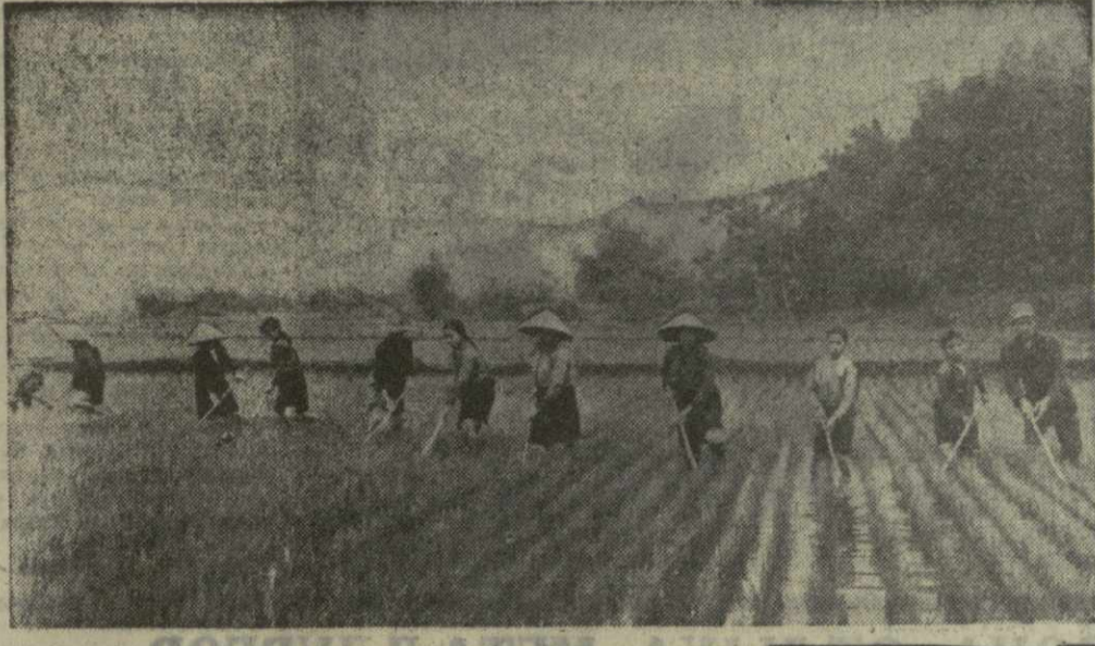
Демократическая Республика Вьетнам. На полях провинции Тханьхоа идет прополка риса. По несколько раз в день крестьянам этого кооператива приходится прерывать работы из-за налетов воздушных пиратов США.

братских партий по вопросам совместной борьбы против империализма, усиления сплоченности социалистического лагеря, повышения руководящей роли рабочего класса и коммунистических партий в социалистических странах. «Единство по этим вопросам», — подчеркивает газета, — наносит сильный удар по всем попыткам империализма ослабить сплоченность социалистического лагеря и вызвать раскол в рядах коммунистического движения». Центральный Комитет, указывая в сообщении, полагает, что Братиславское Заявление шести братских партий отвечает интересам всех братских стран. Оно хорошо служит делу единства международного коммунистического и рабочего движения, социализма, демократии и национальной независимости, дружбе народов, миру.