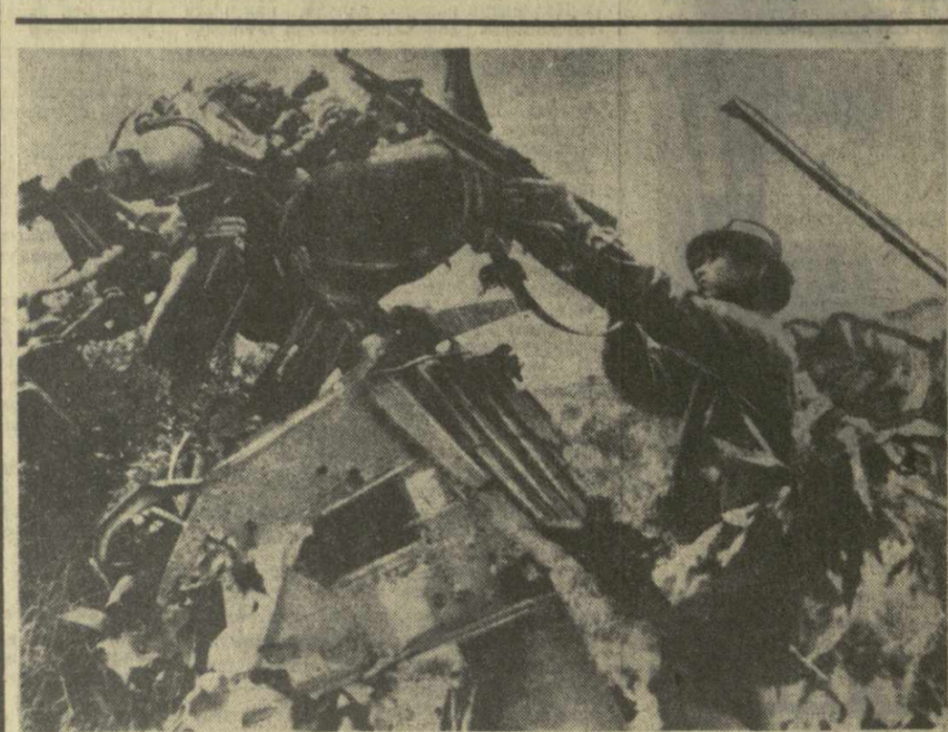
Южный Вьетнам. Боец Народных вооруженных сил освобождения Южного Вьетнама ведет огонь по неприятелю. Подставкой для оружия служат ему остатки сбитого американского вертолета.

По случаю начала строительства советского павильона получено приветственное послание министра внешней торговли и промышленности Японии Э. Министра.