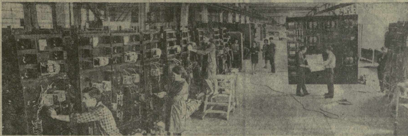
Коллектив завода «Каспийэлектроаппарат» — одного из молодых предприятий республики — успешно несет ленинскую трудовую вахту. Завод выпускает для промышленных центров нашей страны и на экспорт крупнообъемное оборудование, магнитные станции и осветительные приборы. На снимке: общий вид сборочного цеха.

Сельские строители нашей республики хорошо понимают, что каждый кирпич в кладке, каждое новое сооружение — это частичка фундамента светлого здания коммунизма. Вдохновенные призывы ЦК, они еще шире развертывают соревнование за успешное выполнение обязательств, взятых в честь великой даты — 100-летия со дня рождения любимого вождя.