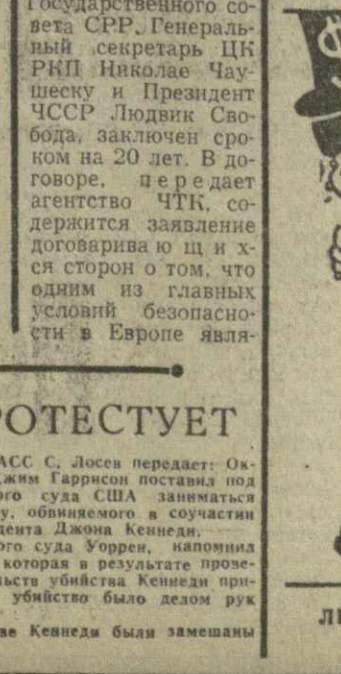
ЛЮБИМОЕ ДЕТИЩЕ АМЕРИКАНСКОГО ИМПЕРИАЛИЗМА. Рис. Г. Ломидзе.

НЬЮ-ЙОРК, 16 августа. Корр. ТАСС С. Лосес передает: Окружной прокурор Нового Орлеана Джим Гаррисон поставил под сомнение моральное право верховного суда США заниматься рассмотрением апелляции Кеня Шот, обвиняемого в соучастии в заговоре с целью убийства президента Джона Кеннеди.