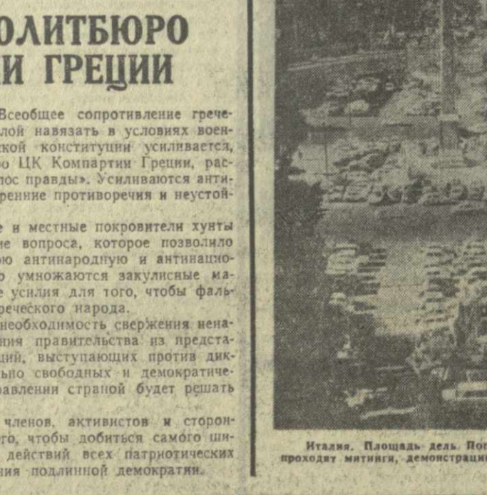
Италия. Площадь дель Попполо в Риме (народная площадь), где проходит митинг, демонстрация, собирают толпы людей.

РИМ, 16 августа. (ТАСС). Всеобщее сопротивление греческого народа попыткам хунты силой навязать в условиях военного режима принятие фашистской конституции усиливается, говорится в заявлении Политбюро ЦК Компартии Греции, распространенном радиостанцией «Голос правды». Усиляются антидиктаторская борьба народа, внутренние противоречия и неустойчивость хунты. В этих условиях иностранные и местные покровители хунты вынуждены искать также решение вопроса, которое позволило бы им продолжать свою реакционную антинародную и антинациональную политику. С этой целью умножаются закулисные маневры и прилагаются настоящие усилия для того, чтобы фальсифицировать подлинную волю греческого народа. В заявлении подчеркивается необходимость свержения неонацистской хунты, образования правительства из представителей всех партий и организаций, выступающих против диктатуры, и проведения действительно свободных и демократических выборов, где вопрос об управлении страной будет решать сам народ. Политбюро призывает всех членов, активистов и сторонников партии сделать все для того, чтобы добиться самого широкого сплочения и совместных действий всех патристических сил, чтобы добиться восстановления подлинной демократии.