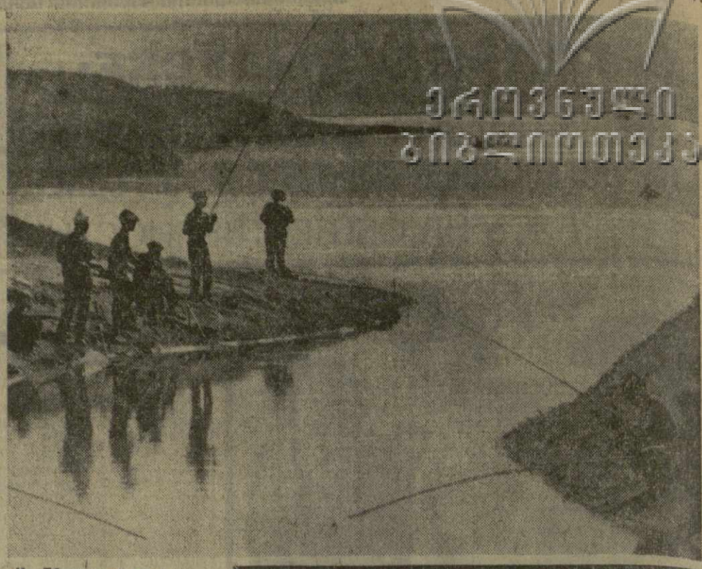
На Тбилисском море.