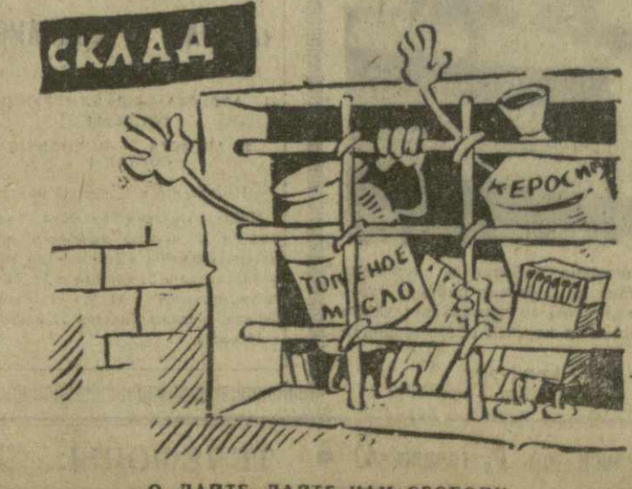
О, ДАЙТЕ, ДАЙТЕ НАМ СВОБОДУ. Рис. А. Канделаки.