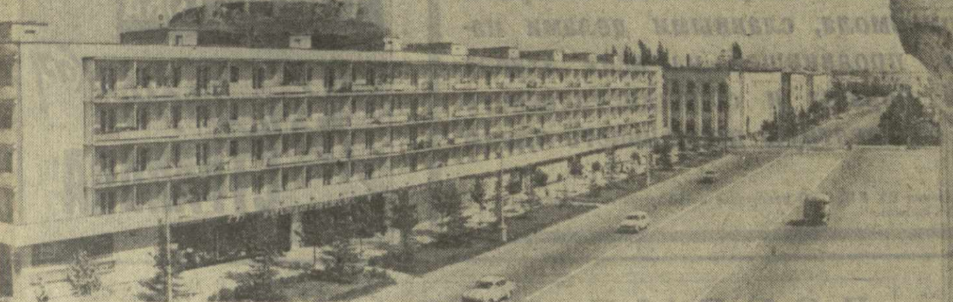
С каждым днем хорошеет и меняет свой облик древний Гори. Сегодня улицы города украшают многоэтажные современные дома, парки и скверы. На снимке: центральная часть города.