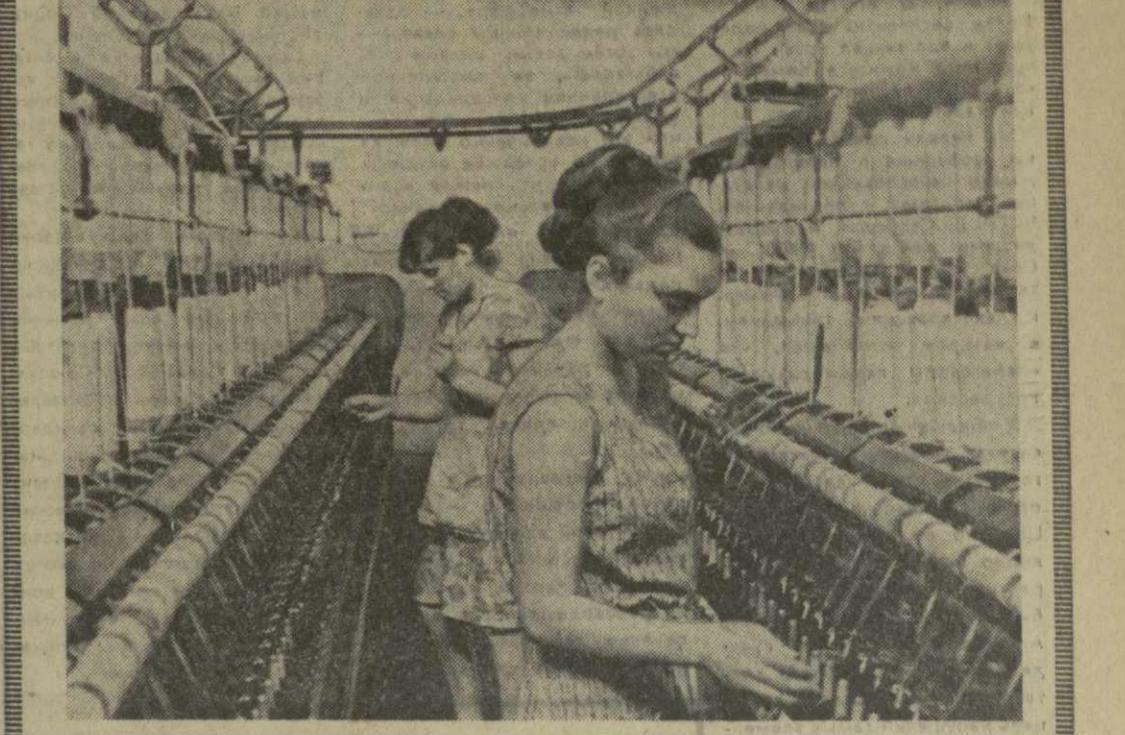
Тбилисская фабрика искусственного волокна