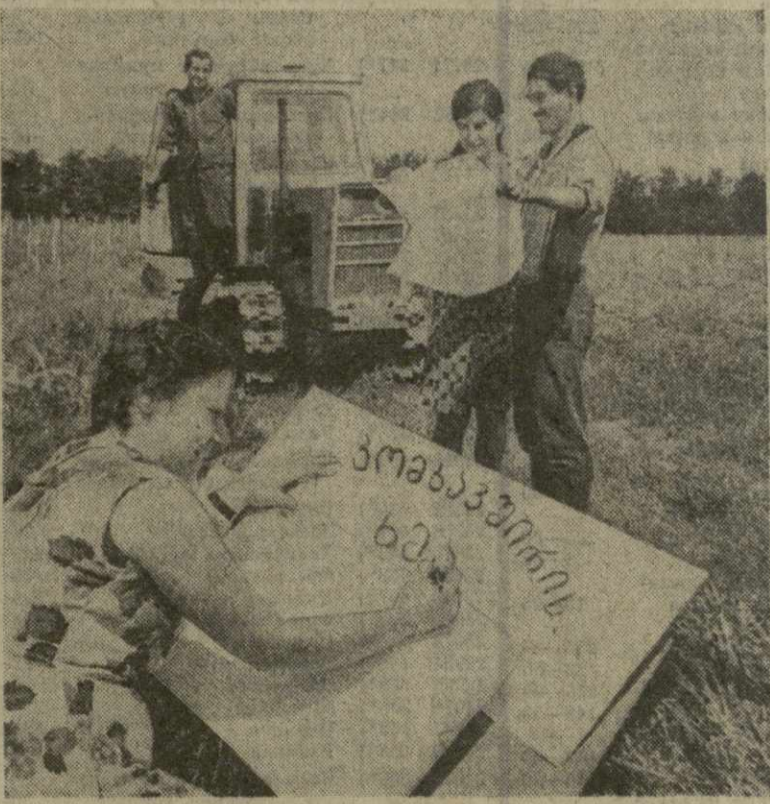
А. МИТАВРИЯ. (Корр. «Зари Востока»).

8.000 с лишним молодых научных работников работает в научно-исследовательских учреждениях нашей республики.