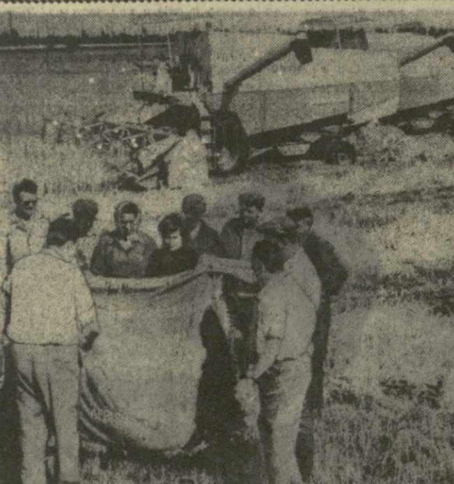
Германская Демократическая Республика. Большую роль в успешной уборке урожая зерновых играет в этом году новая сельскохозяйственная техника «Е-512».