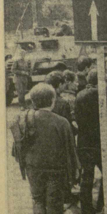
Воиска социалистических стран на территории Чехословакии.

На снимке: советские солдаты беседуют с местными жителями.