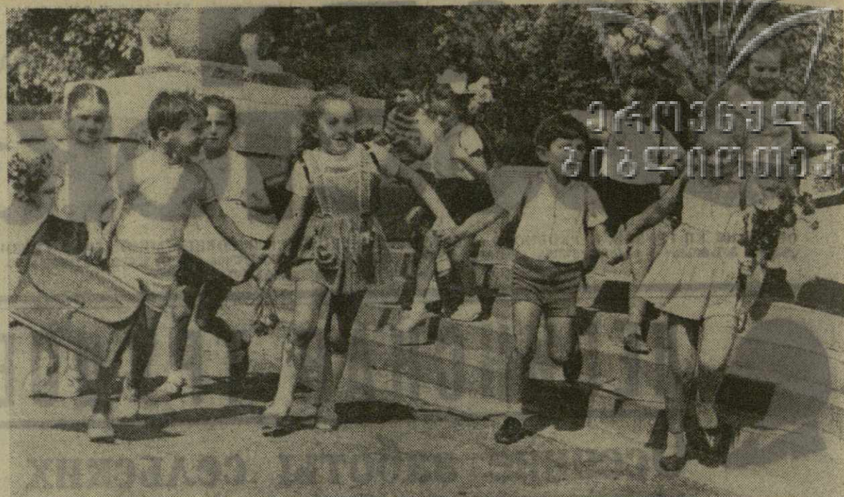
Заключен первый день учебы. На снимке: ученики 1-го класса 55-й тбилисской средней школы после занятий.

В третьем классе сегодня начнется эксперимент, цель которого — проверить новый учебный материал по грузинскому языку и систему упражнений для развития культуры речи. Эксперимент проводит педагог нашей школы Баян Пугуридзе.