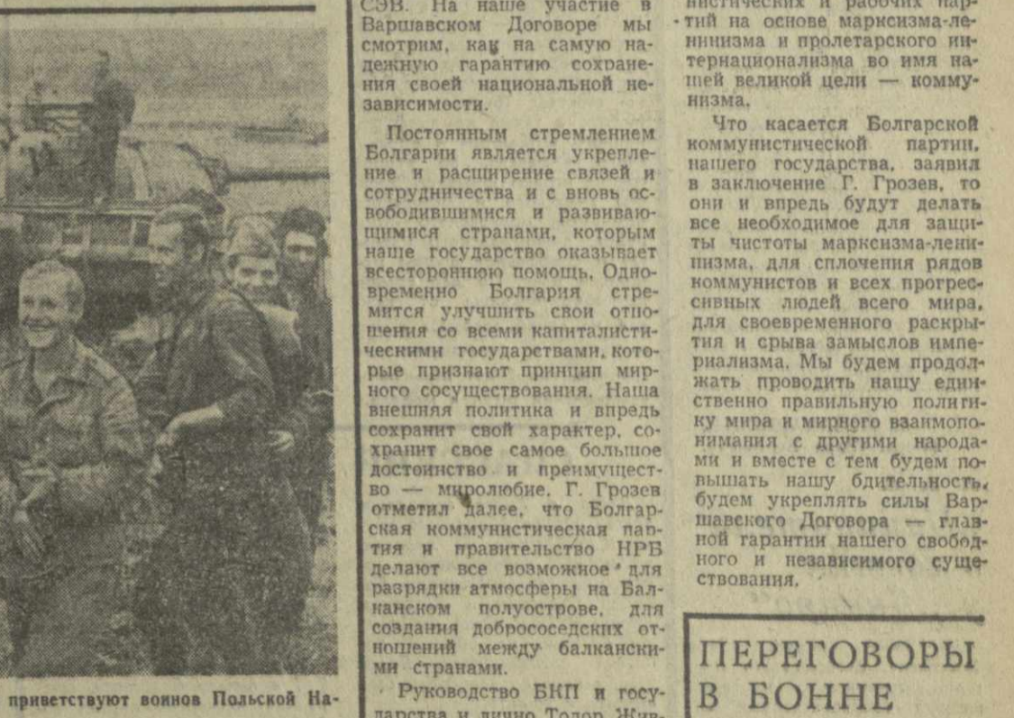
Бойцы Советской Армии приветствуют воинов Польской Народной Республики.