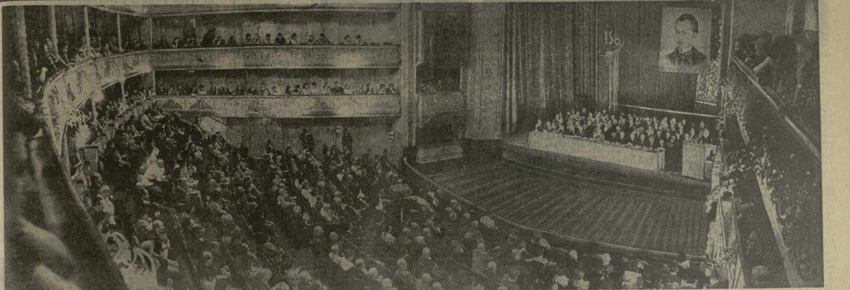
Тбилиси, 10 сентября 1968 года. На снимке: в зале заседания объединенного пленума правлений союзов писателей СССР и Грузии, посвященный 150-летию со дня рождения великого грузинского поэта и мыслителя Николаоза Бараташвили в Тбилиском государственном академическом театре оперы и балета им. З. Палиашвили.

ВЧЕРА СОСТОЯЛСЯ ОБЪЕДИНЕННЫЙ ПЛЕНУМ ПРАВЛЕНИЙ СОЮЗОВ ПИСАТЕЛЕЙ СССР И ГРУЗИИ, ПОСВЯЩЕННЫЙ ЮБИЛЕЮ ВЕЛИКОГО ГРУЗИНСКОГО ПОЭТА И МЫСЛИТЕЛЯ.